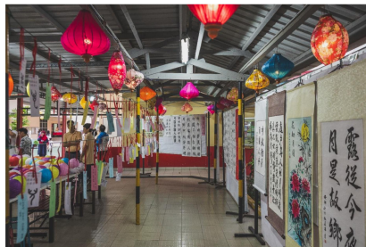
中秋節“花好月圓，情滿奕中”展示區

此活動獲得了駐汶萊臺北經濟文化代表處支持，並得到中華民國僑務委員會的慷慨贊助，令活動圓滿成功。