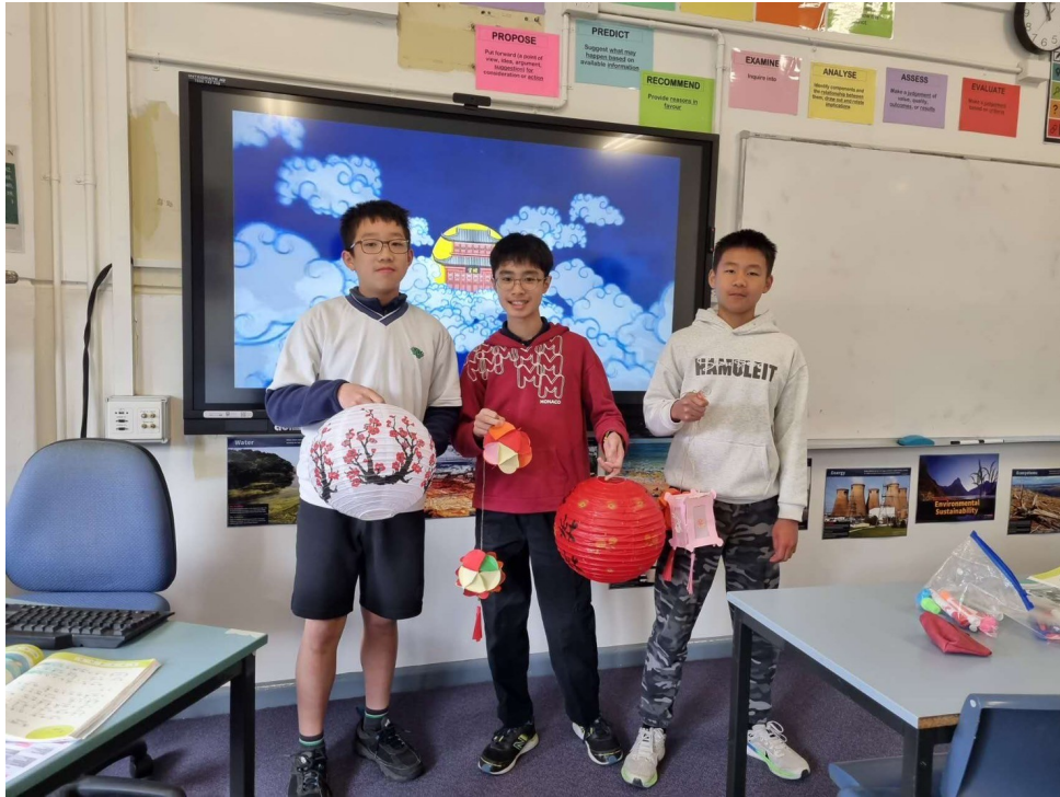
雪梨慈濟人文學校老師 舉辦2024中秋節活動6