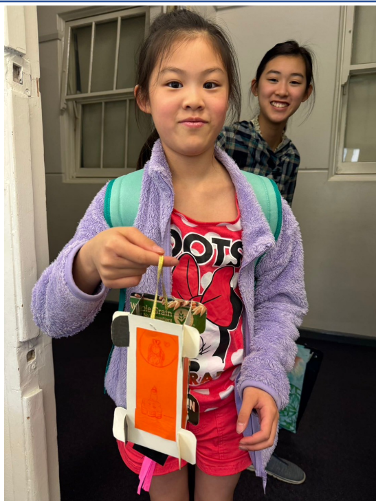
雪梨慈濟人文學校老師 舉辦2024中秋節活動2