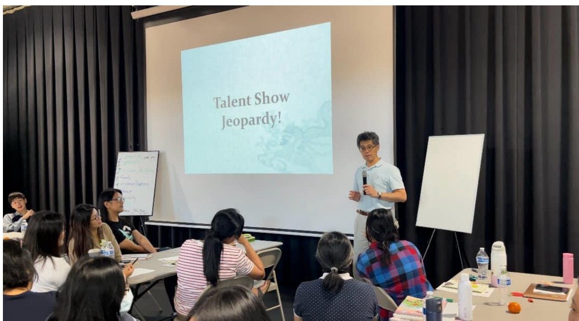
華府台灣學校舉辦2024台語教師研習會1

此外，活動中還邀請了三位經驗豐富的教師，分別代表小學、國中和高中進行分享與指導。他們透過分組討論和模擬課程，針對各個年齡層學生在台語學習中可能遇到的挑戰提出了具體的解決方案：包括提供有趣的字卡，以文字競賽的搶答方式，教學使用的遊戲等方式，給在場老師們非常實用明的課堂操作技巧。這些分組討論不僅促進了教師之間的經驗交流，也為未來的台語課程設計提供了實用的建議和方向。參與的教師們皆表示此次培訓受益良多，為日後的台語文教學奠定了更堅實的基礎。