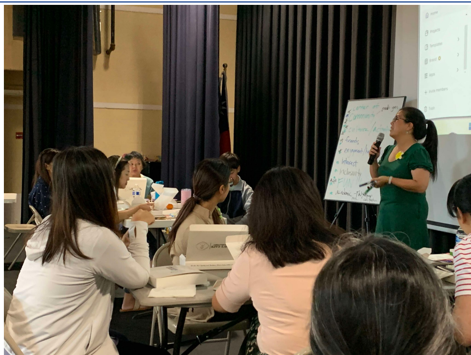
華府台灣學校舉辦2024台語教師研習會2