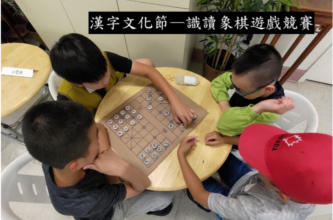
孩子們認真下象棋