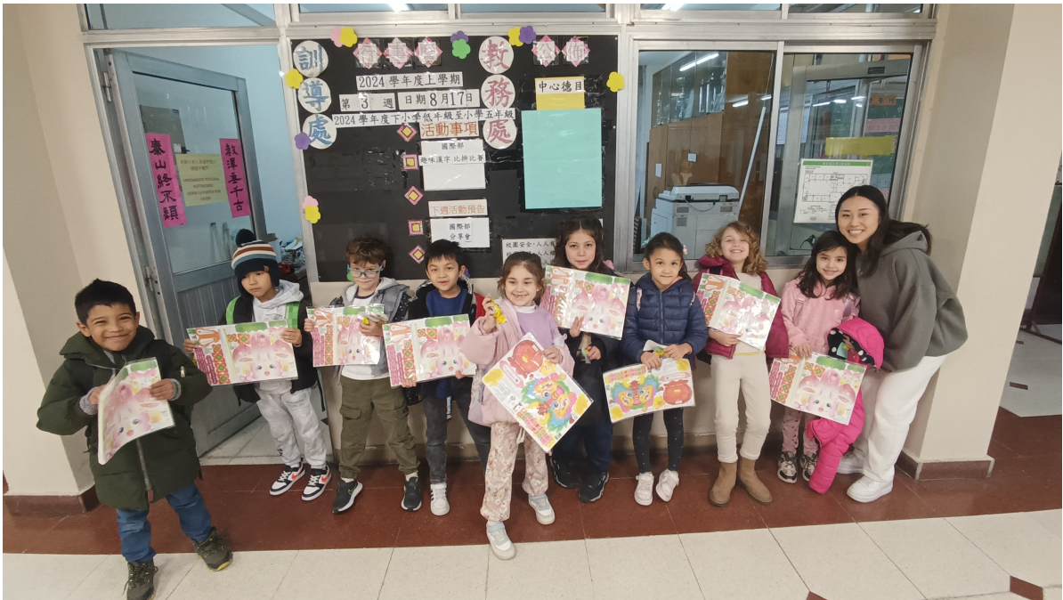
2024新興文教中文學校國際部趣味漢字比拚比賽3