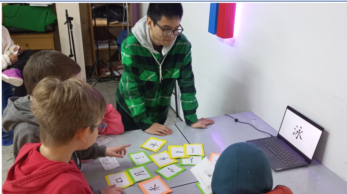
2024新興文教中文學校國際部趣味漢字比拚比賽2