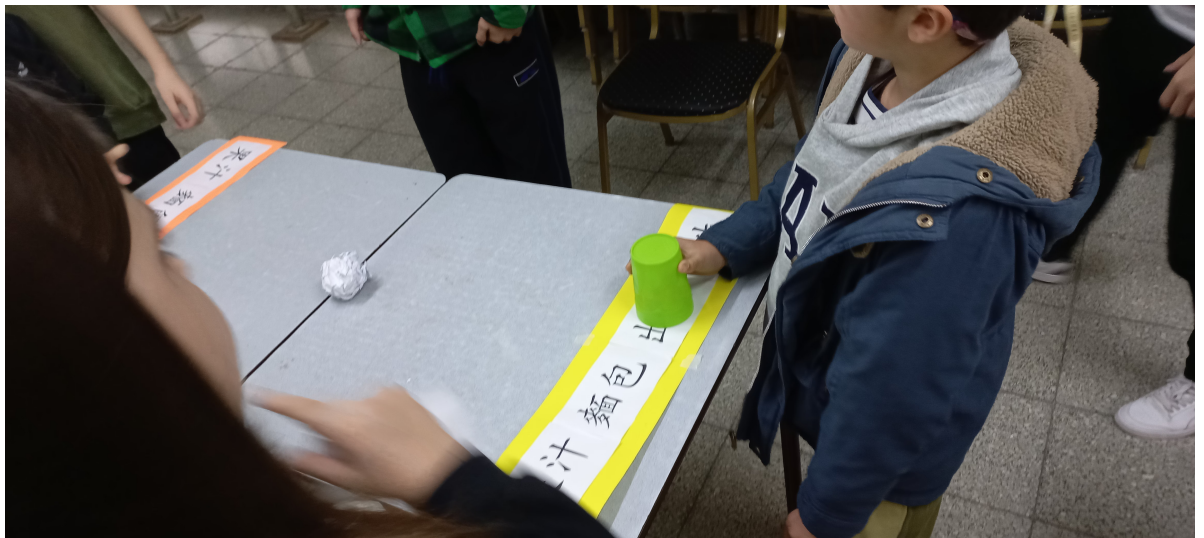
2024新興文教中文學校國際部趣味漢字比拚比賽1

新興文教中文學校於本學期第三週（八月十七日）早上，舉行了國際部趣味漢字比拚比賽，宗旨在於能由此活動將學生對漢字的結構，藉著遊戲和競賽的方式，達到認字及其文字本身的意義，並激發學生對學習中文字的興趣和了解。參加對象為國際部低中高年級生，9:40至10:20是五六年級生，10:30至11:10是三四年級生，11:20至12:00是一二年級生。比賽方式是分成三關，一組由三個人同時參加，各發一枚棋子，每個學生依順序投骰子，並根據骰子的數字在大富翁的地圖上移動自己的棋子（前進），學生必須得用中文唸出移動的步數，否則扣分，最先到達終點的可以過關，每輪對抗取二名贏家。第二關是認字加反應速度，由兩位學生分發一張遊戲卡和一個杯子，遊戲卡裡有四個詞語，當主持者念詞語時學生須迅速將杯子蓋住那詞語，成功者可得一球，以球數來計分。第三關是將文字的部首正確選出，每字以十秒為限，以此類推來計分。當比賽的學生完成了三關的考驗，再將分數加以統計，即能分組列出得獎者。這種活動通常是學生所喜愛的，老師也樂此不疲地設計圖卡和字卡，為了能藉著不斷翻新的文字遊戲，讓學生深深愛上漢字，無論在聽說讀寫上都能相得益彰。