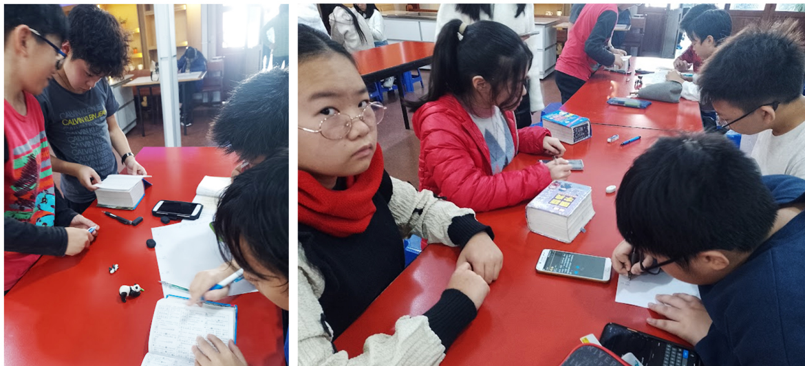
2024學年度愛育學校 「正體漢字文化節國語文國小高年級組語詞接龍比賽」2