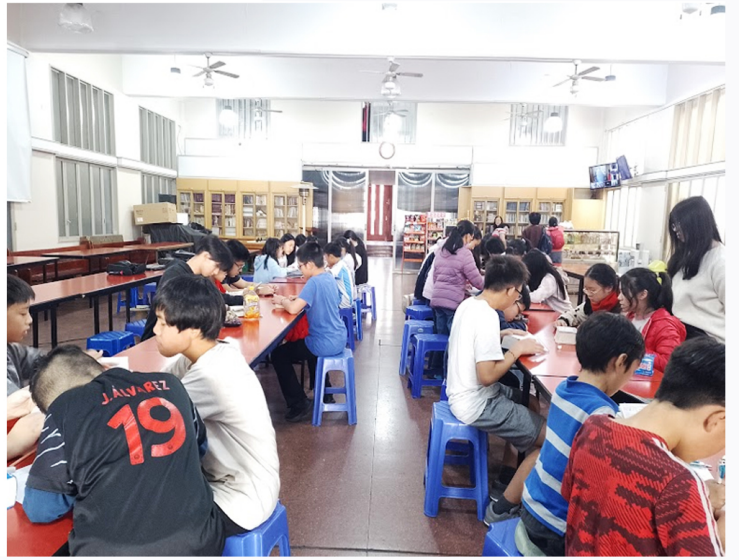
2024學年度愛育學校「正體漢字文化節國語文國小高年級組語詞接龍比賽」6