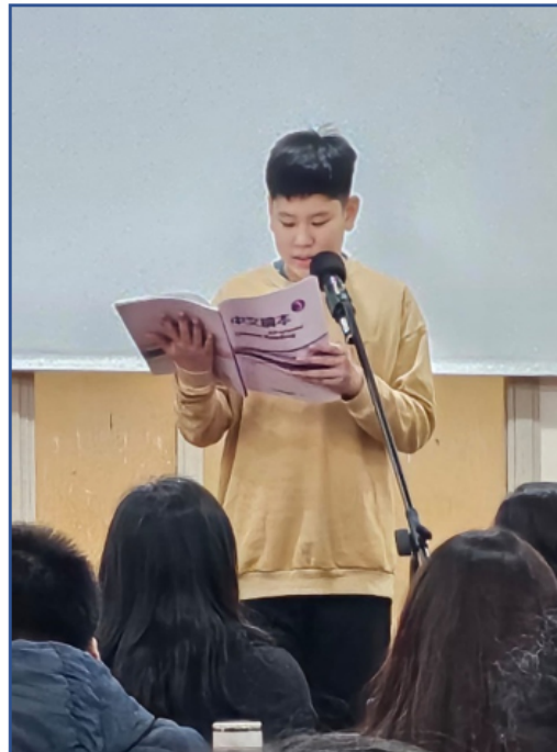
2024學年度愛育學校 正體漢字文化節「朗讀決賽」5