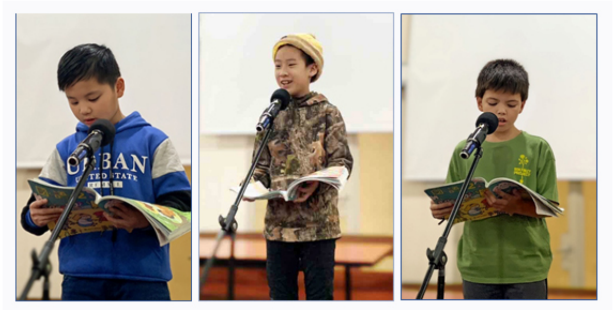
2024學年度愛育學校 正體漢字文化節「朗讀決賽」1