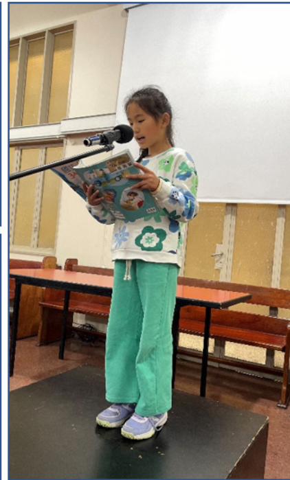
2024學年度愛育學校 正體漢字文化節「朗讀決賽」3