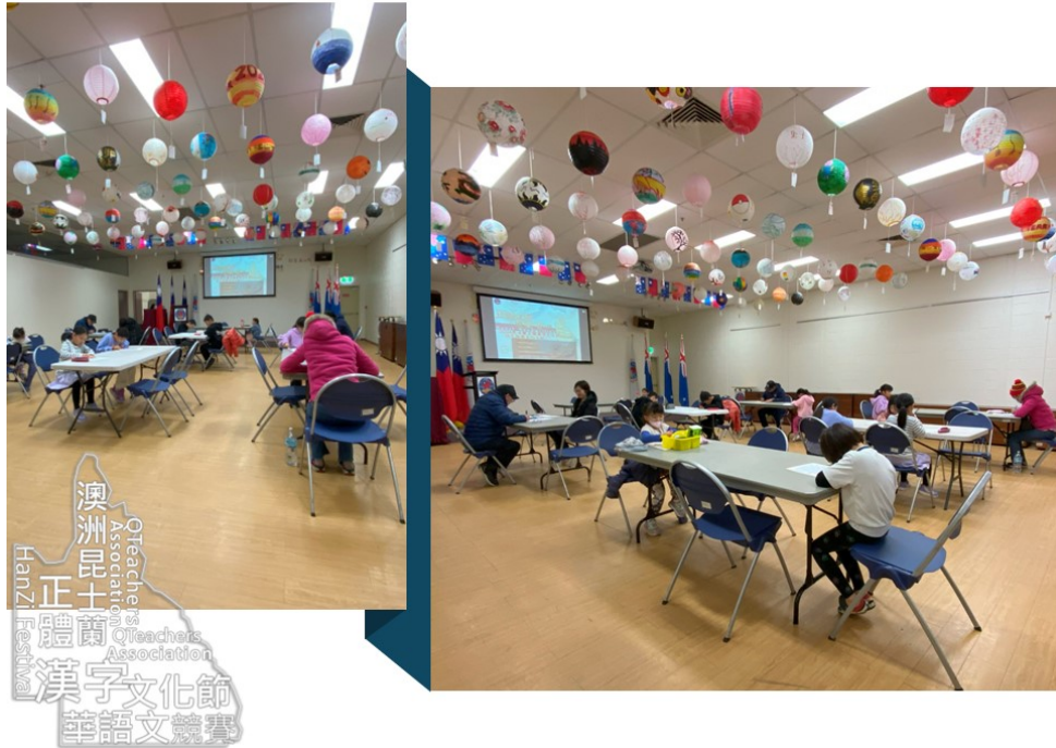
昆士蘭2024正體漢字文化節硬筆字書寫5