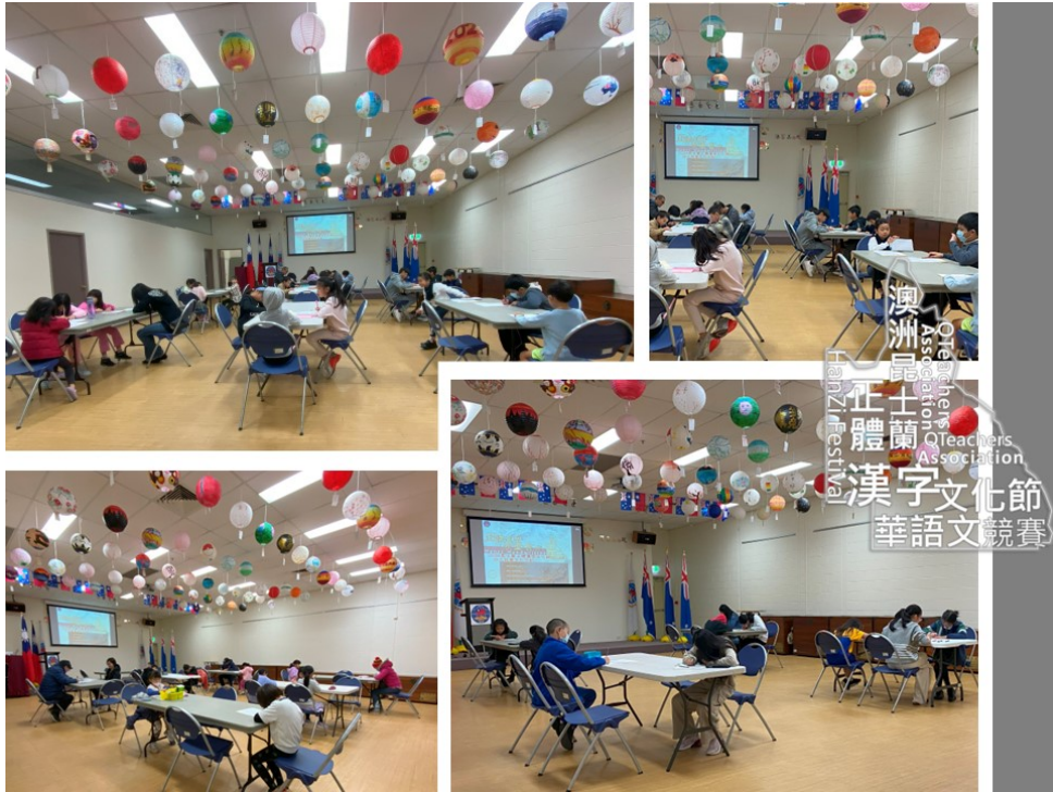
昆士蘭2024正體漢字文化節硬筆字書寫6