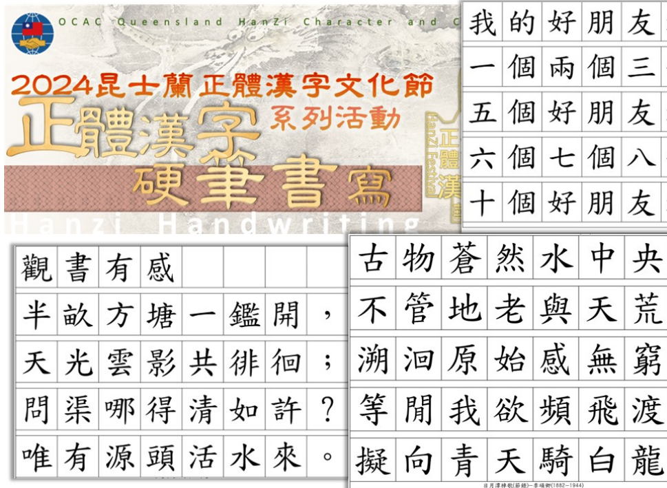
昆士蘭2024正體漢字文化節硬筆字書寫4

#澳洲 #昆士蘭 #正體漢字文化節 #硬筆字書寫 #昆士蘭華語文教師聯誼會 #布里斯本華僑文教服務中心