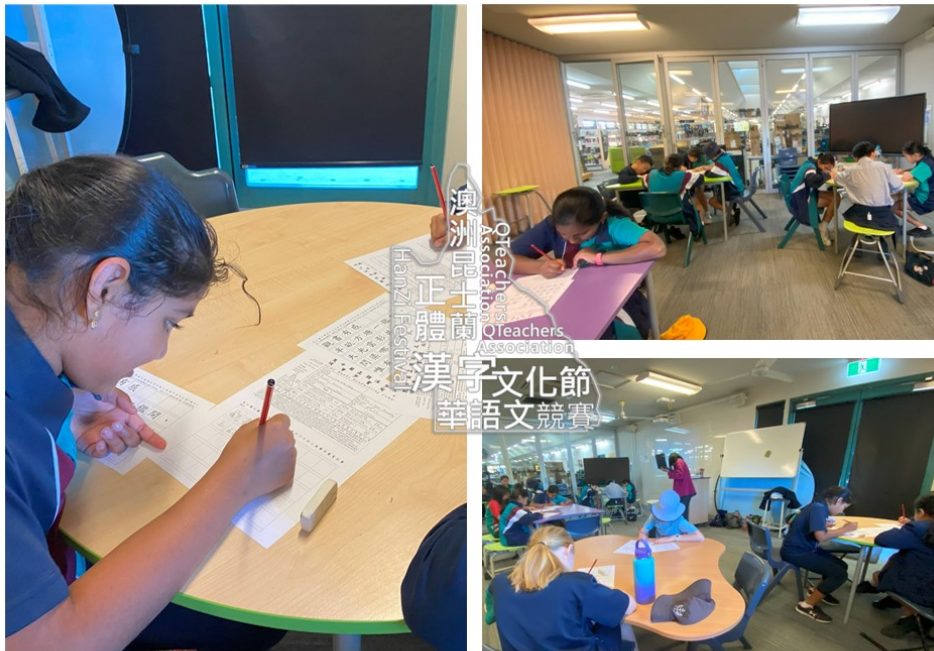
昆士蘭2024正體漢字文化節硬筆字書寫3