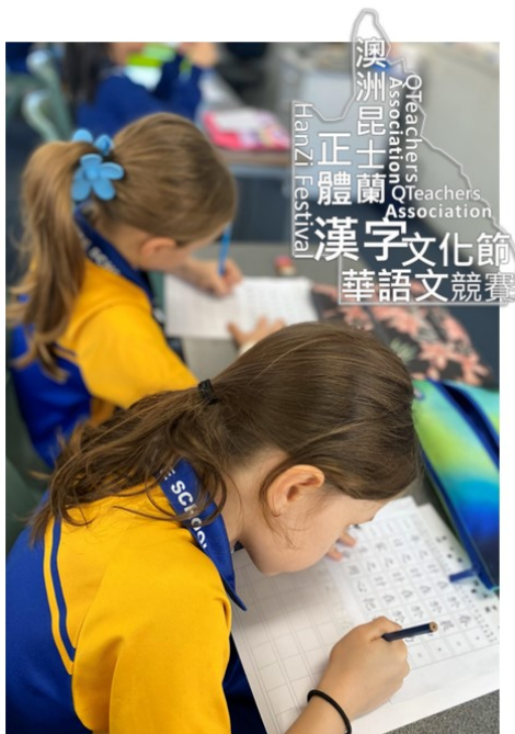
昆士蘭2024正體漢字文化節硬筆字書寫2