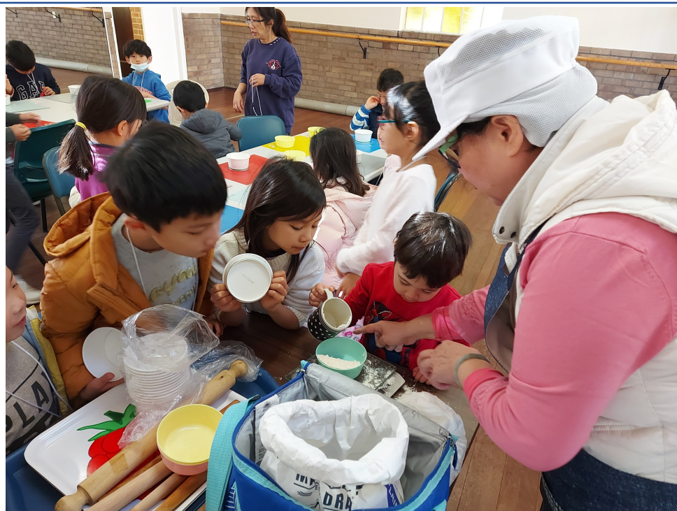
專心聽解說的小朋友