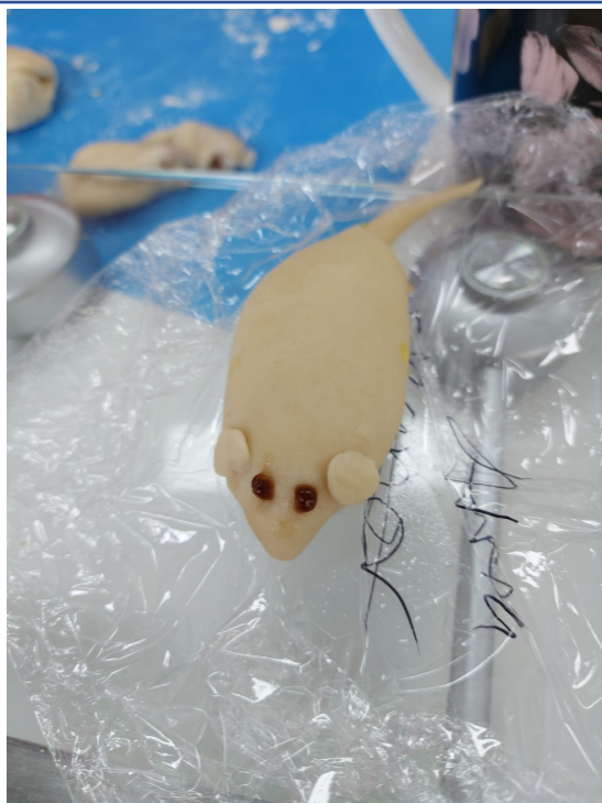
小朋友唯妙唯俏的作品