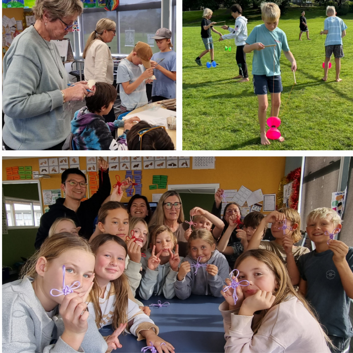
Waihi Beach School的師生專注參與多元課程、自信展現學習成果