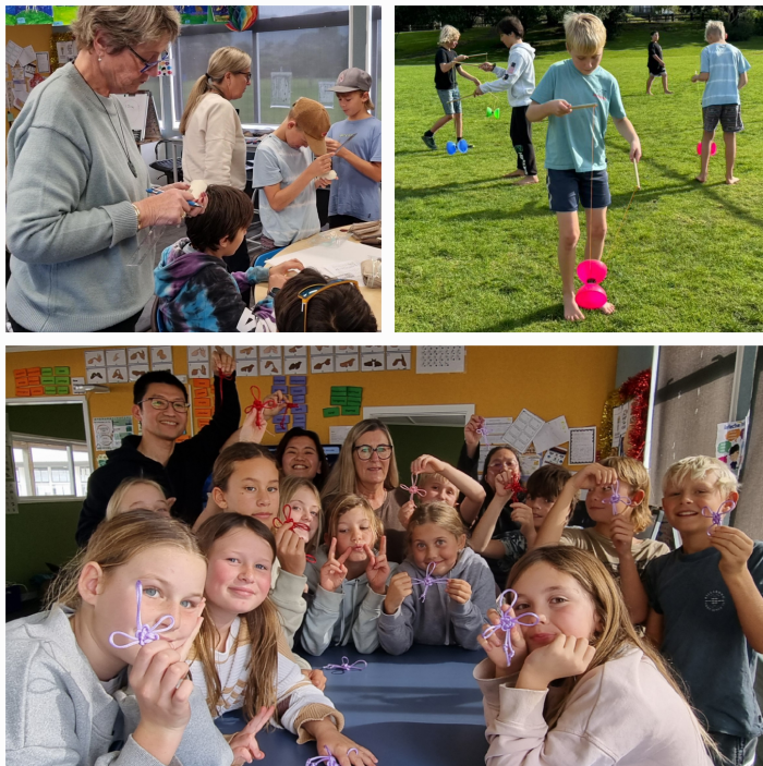
Waihi Beach School的師生專注參與多元課程、自信展現學習成果