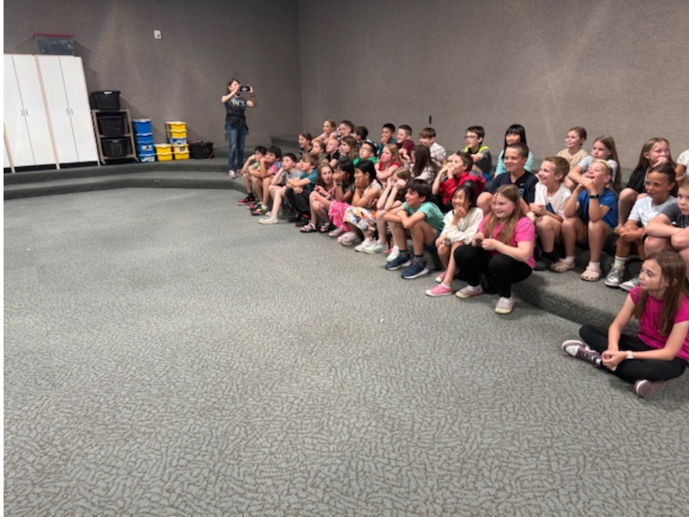
臺美兩地小學生線上交流