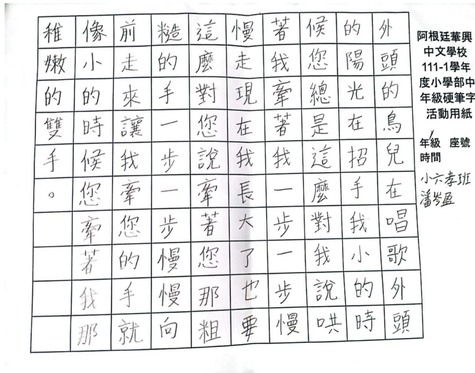
華興文教小學部線上硬筆字活動1

感謝僑委會督導鼓勵辦助相關漢字文化節活動，也感謝老師們耐心地教導孩子們，讓同學們在學習的過程中，也能不斷地有自我評量的機會，讓孩子的學習過程中，更豐富了多元性成長的機會。