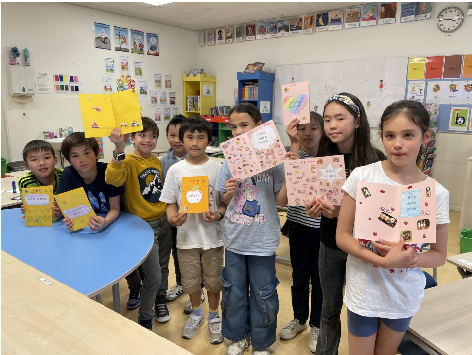
手作祝福卡/感恩卡