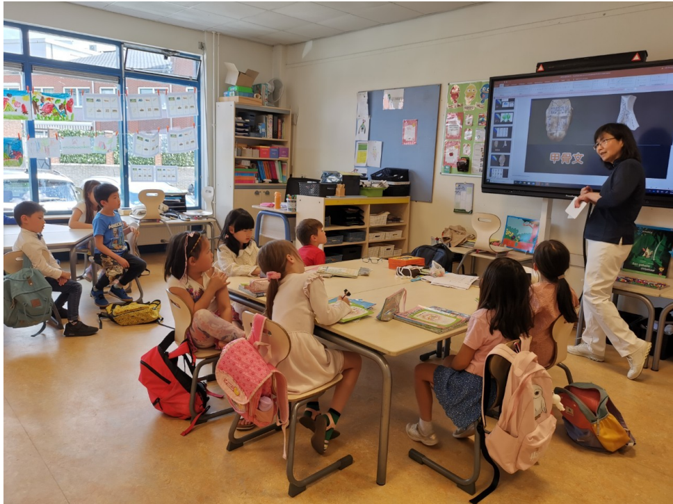
有趣的文字、文字起源的故事及象形文字