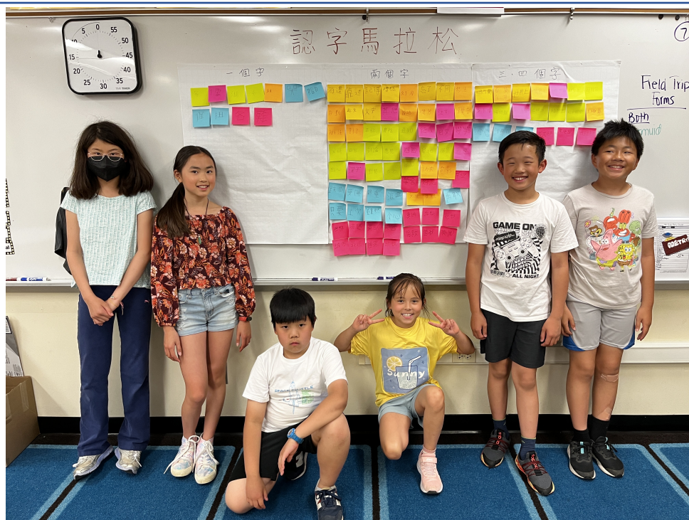
四年級學生，以遊戲方式，複習貼在白板上的全部字詞後，開心合影