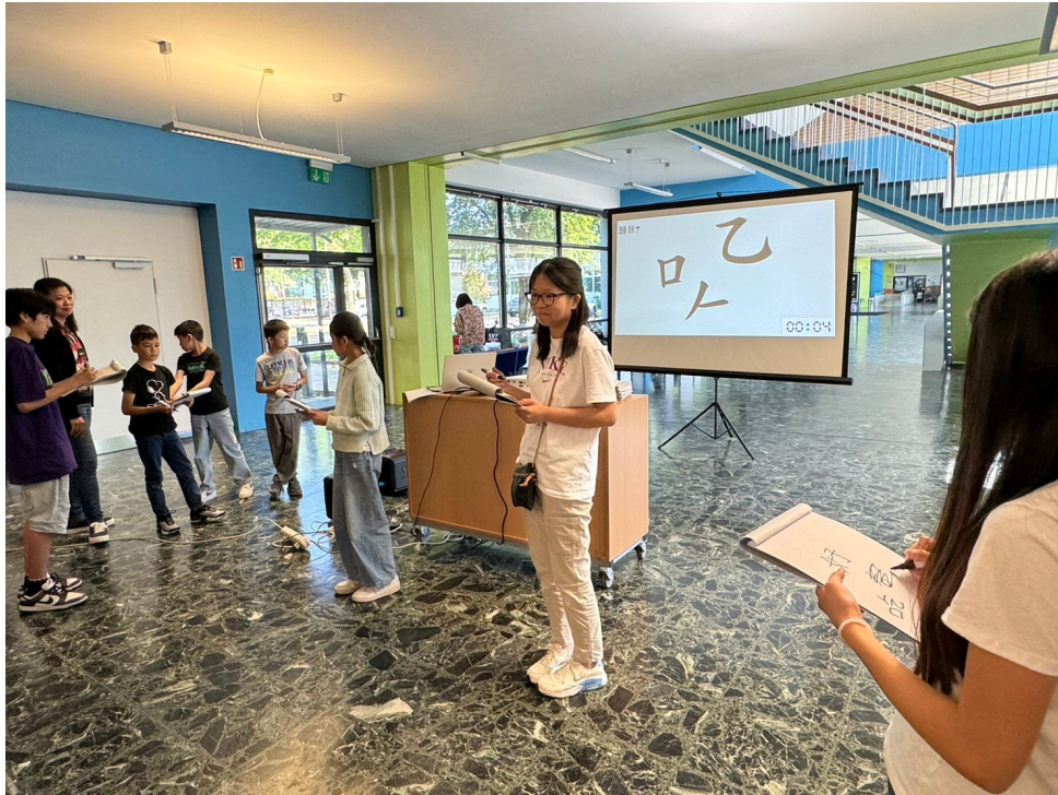
2024年福爾摩沙中文學校端午正體漢字競賽4