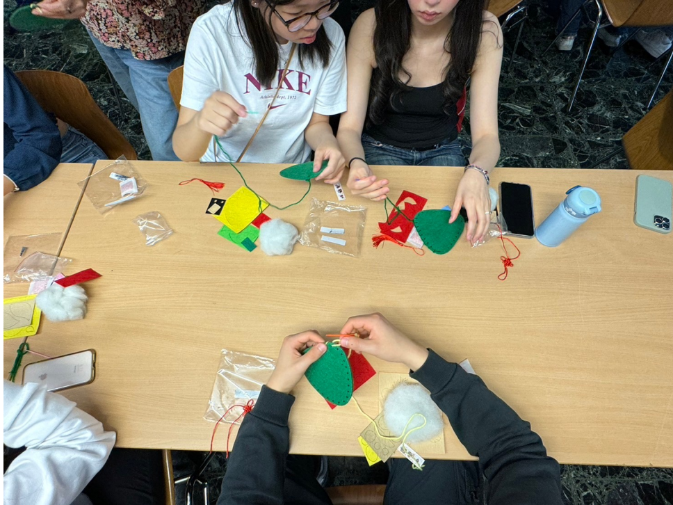
2024年福爾摩沙中文學校端午正體漢字競賽5