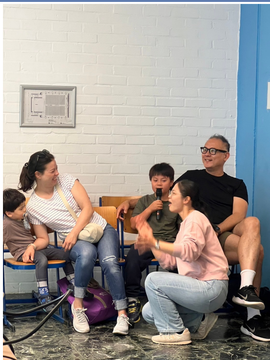
2024年福爾摩沙中文學校端午正體漢字競賽2