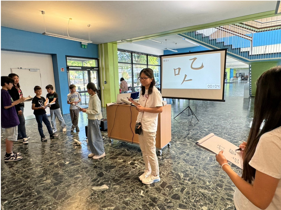
2024年福爾摩沙中文學校端午正體漢字競賽4