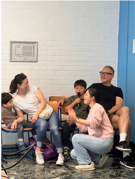
2024年福爾摩沙中文學校端午正體漢字競賽2