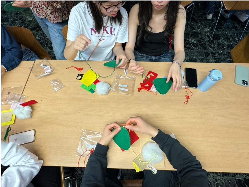
2024年福爾摩沙中文學校端午正體漢字競賽5