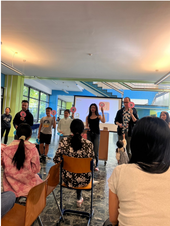
2024年福爾摩沙中文學校端午正體漢字競賽3