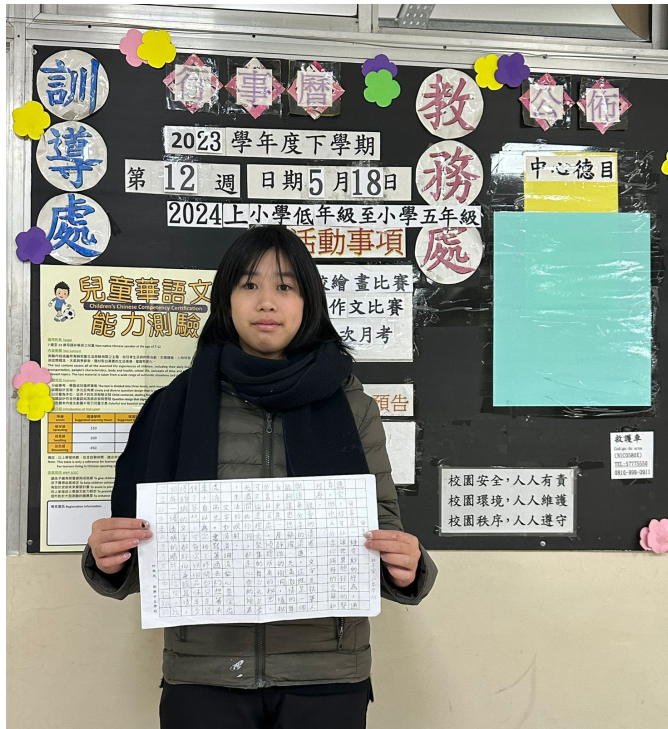
113年正體漢字文化節系列活動 阿根廷新興中文學校全校作文比賽1

藉著華僑救國聯合總會一年一度的徵文比賽，由於意義和目的相同，就融入漢字文化節系列活動一起辦理。鼓勵學生寫作一直是本校積極推廣教學的工作，因此如何教導學生多閱讀，將所學的中文運用在生活，無論在聽說讀寫，聽得懂中文的對話，能看得懂除了課本內容外，其他童話或文化書籍等讀物，也能正確讀出準確的文字讀音，有了這些基本條件後，再由作文老師逐步教導正確的標點符號。誰說國外的學生不能寫出精采的文章來，「天下無難事，只怕有心人」不是嗎？再加上本校二樓走道排滿了許多適合學生閱讀的課外書籍，任由學生取用。有時家長也會來借用，有愛看書的家長，相信就有愛閱讀的小朋友，有喜愛讀故事書的孩子，一定有愛寫作的學生，讓我們一起來驗收這次寫作比賽的成品吧。資格是小學部由小學三年級以上，中學部是初中部和高中部。小學部的題目有「最美的時光」、「印象最深刻的一件事」、「分享」、「生命的色彩」、「得失之間」、「青春的夢想」，高中部的題目是「生活魔術師」、「我的心靈花園」、「E世代的聯想」等，文字數目要求是小學部300-700，初中部800-1000，高中部1200-1500。