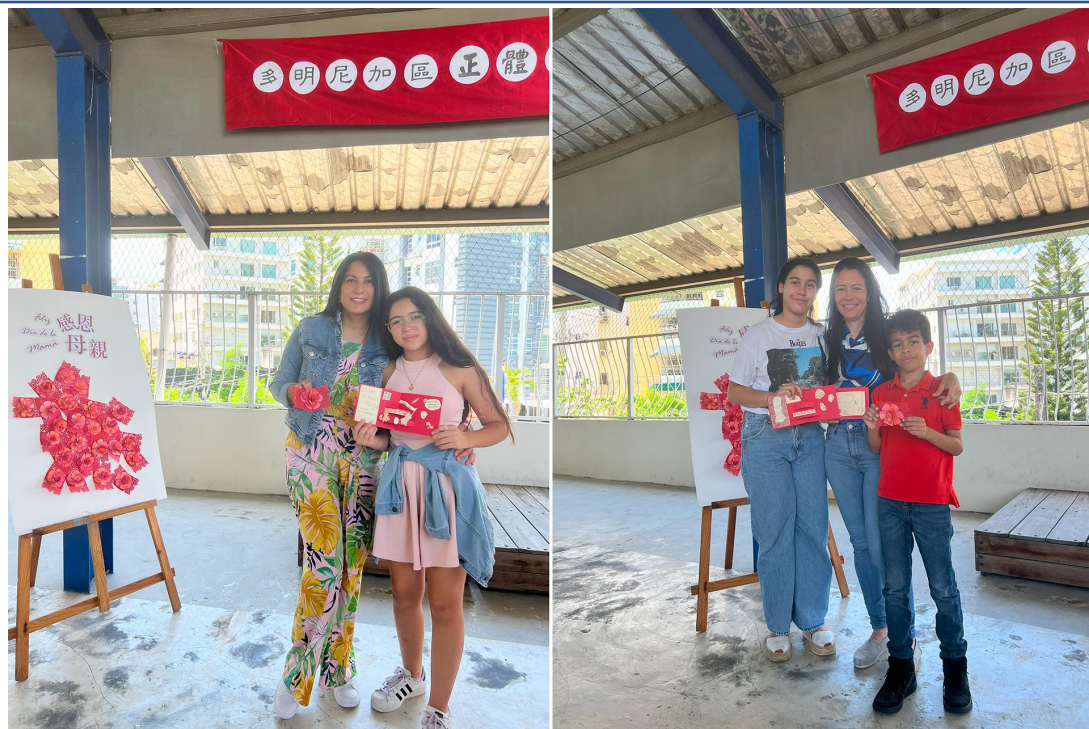
多明尼加臺灣商會附屬中文學校2024母親節活動 - Feliz día de la Mamá 感恩母親5