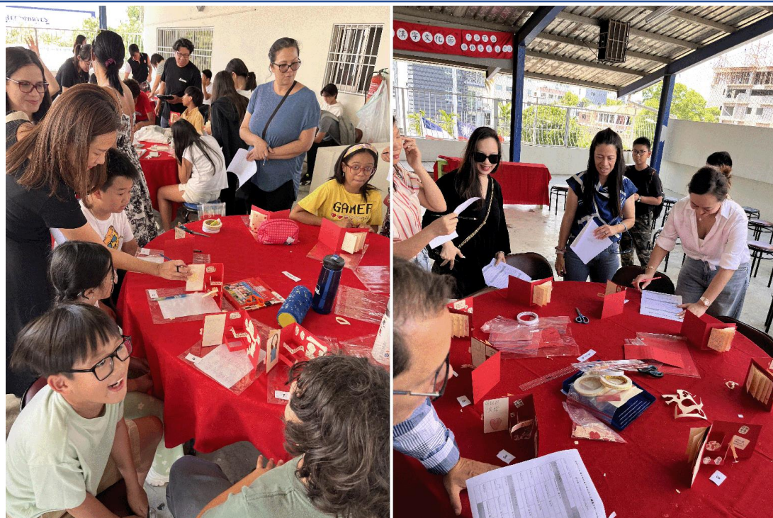
多明尼加臺灣商會附屬中文學校2024母親節活動 - Feliz día de la Mamá 感恩母親3