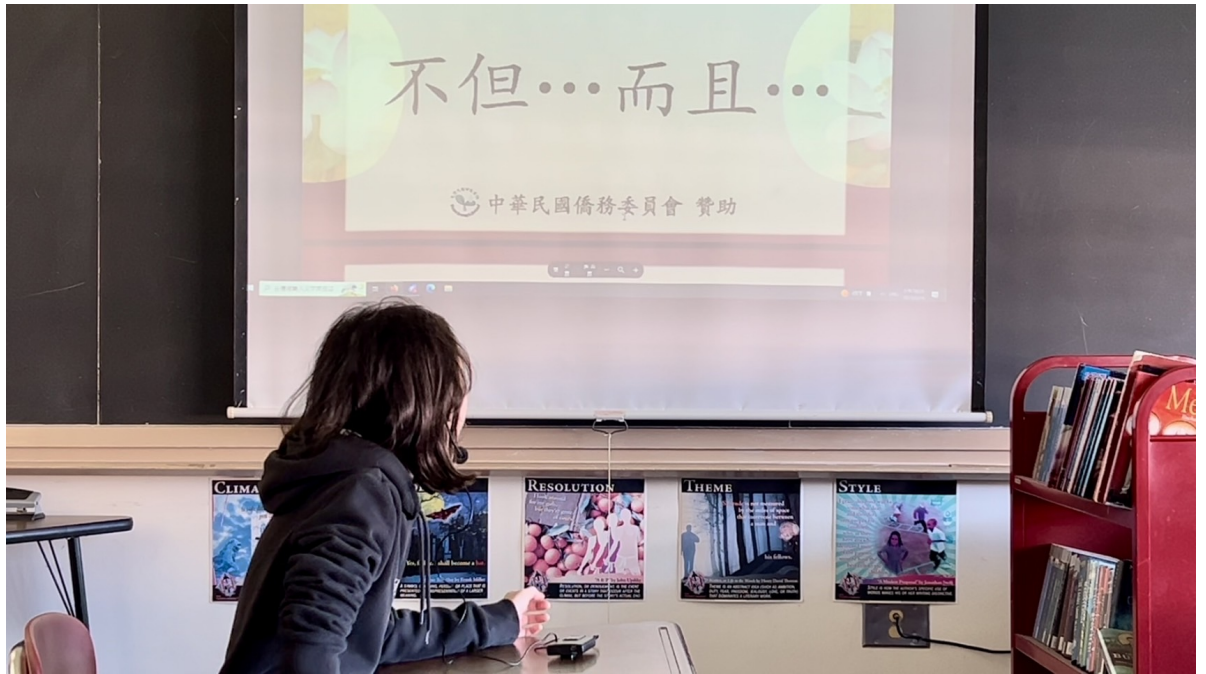
五年級同學識字識詞考試