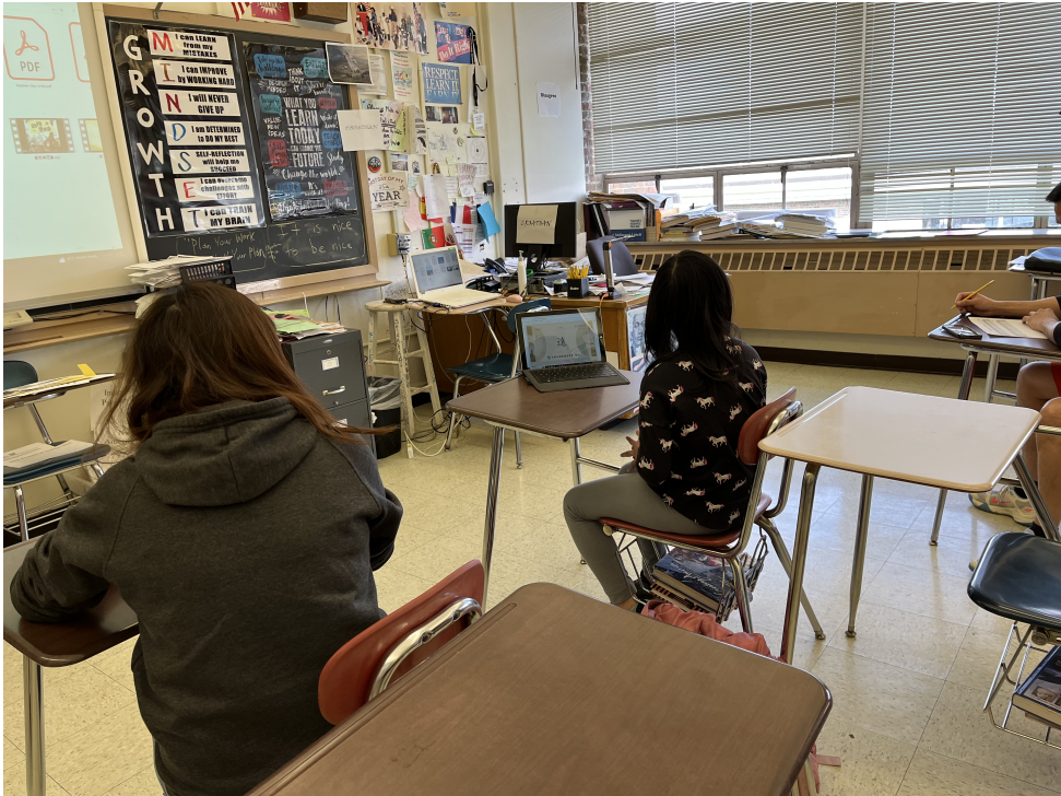
四年級同學識字識詞考試