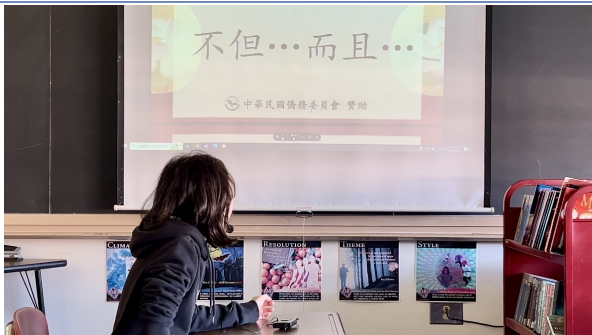
五年級同學識字識詞考試