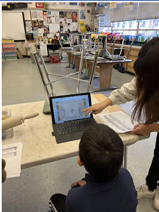
一年級同學識字識詞考試