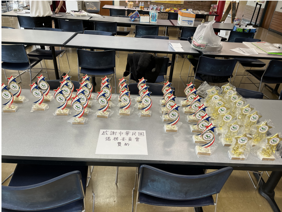
識字識詞考試獎杯