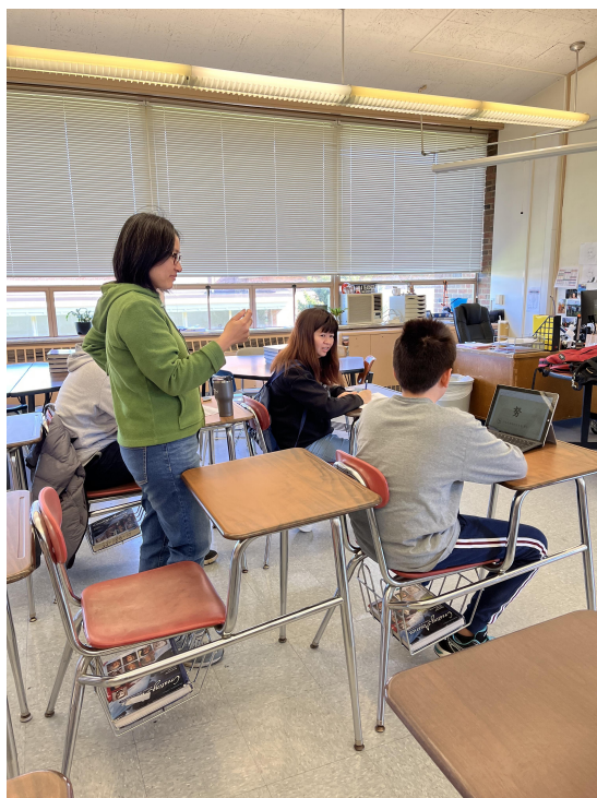
六年級同學識字識詞考試

克里夫蘭中文書院在每年春季班舉辦的中文正體字識字識詞比賽活動，已行之有年。此活動於三月下旬開始，一直到五月初結束，各班級學生會輪流參加考試。對於傳統班的學生們，老師會隨機挑選過去學過的15個生字，要求學生回答及造詞。另外，會挑選10個生詞，要求學生造句。對於中文第二外語班的學生們，考試主要以對話方式進行，要求同學們能回答與測驗官的基本日常生活對話。另外，對於中高年級的學生，會再要求自我介紹的部分。透過對話來評量學生的聽力以及對正體字發音與說話的技巧。本次活動圓滿結束，已在五月初將各獎項及獎狀頒發給參加的同學，提高學生學習興趣及鼓勵學生們繼續學習中文。