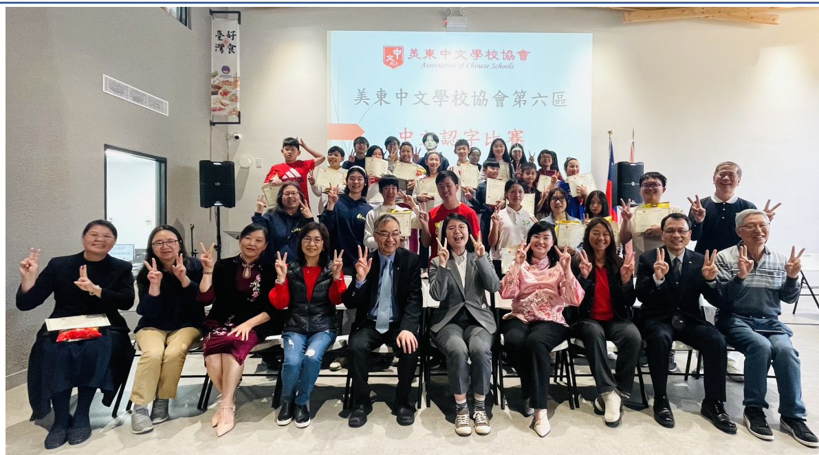
大合影：參賽學生在領獎台上笑顏逐開