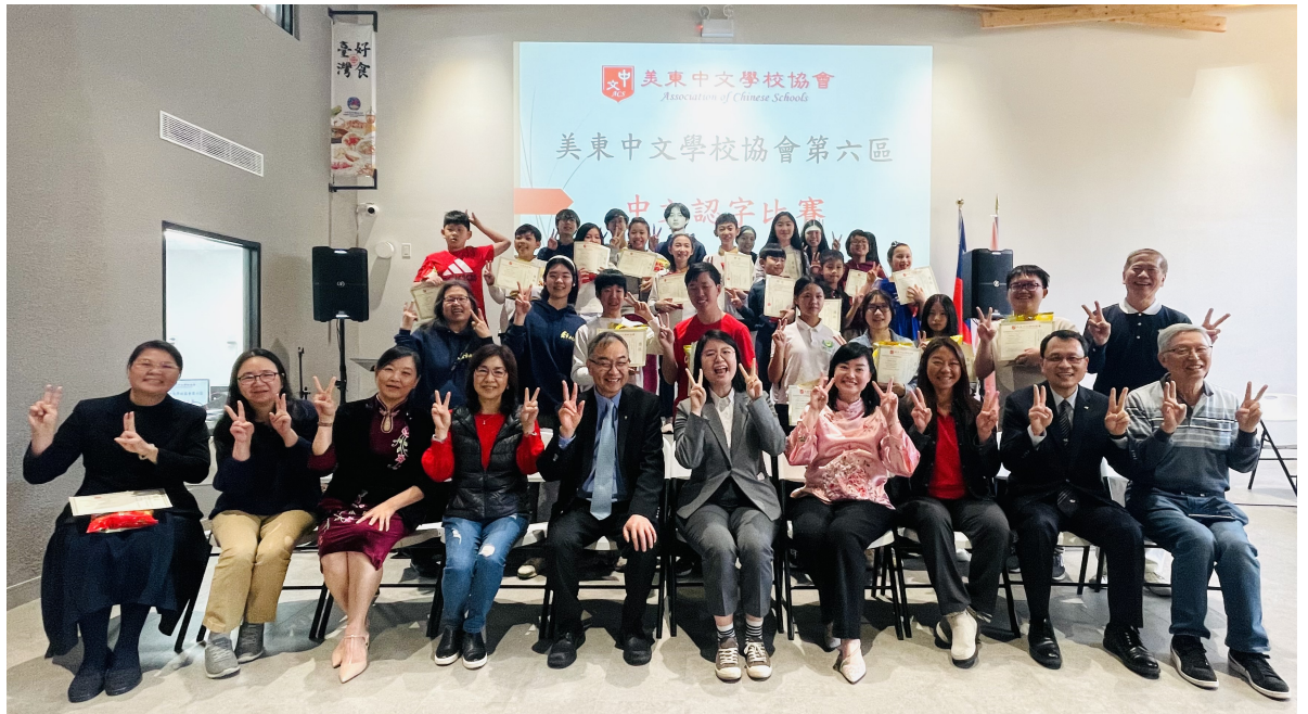
大合影：參賽學生在領獎台上笑顏逐開