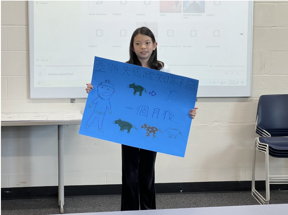
參賽學生創作海報解釋成語典故