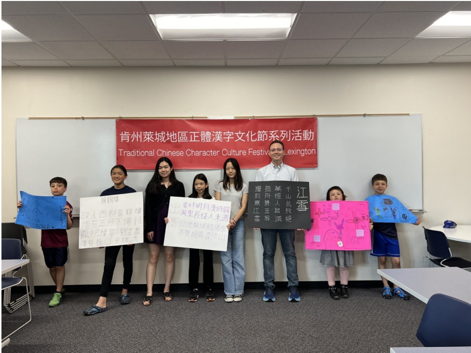
參賽學生展示創作