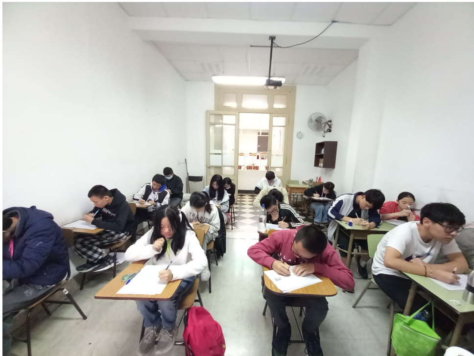
阿根廷華興中文學校2024中學部作文比賽6