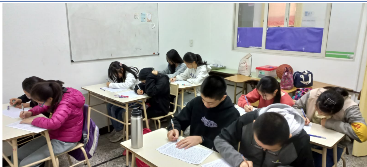
阿根廷華興中文學校2024中學部作文比賽5