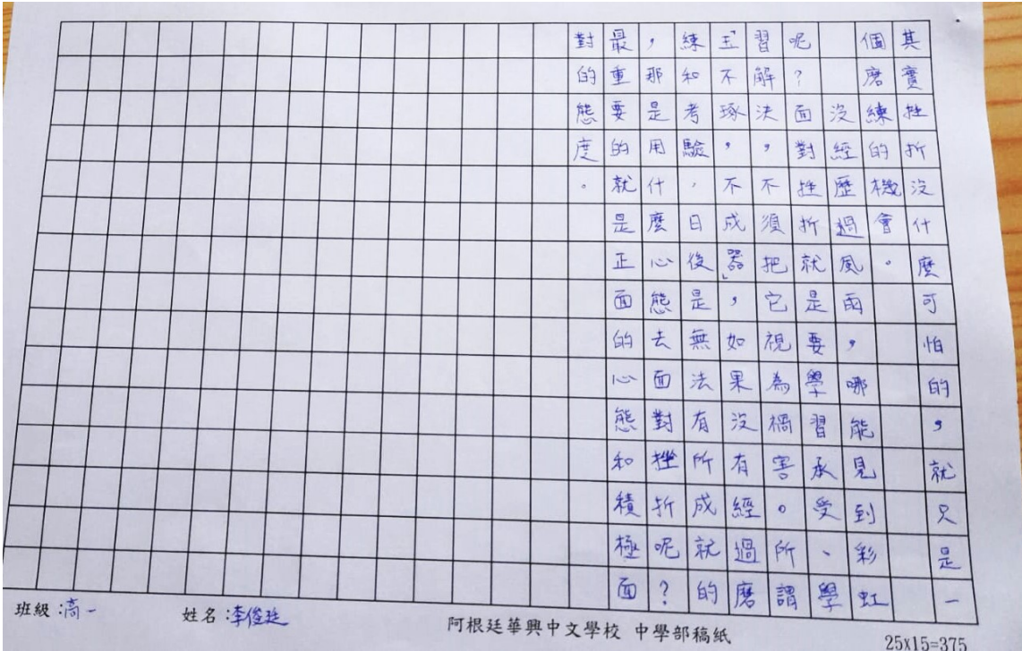
阿根廷華興中文學校2024中學部作文比賽3