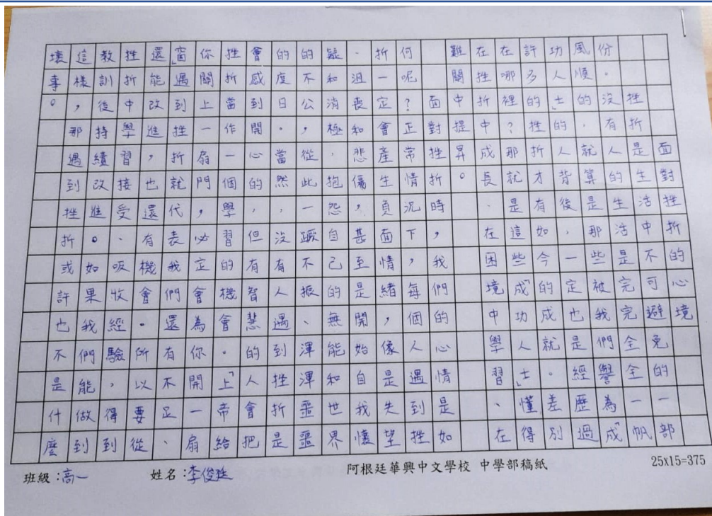
阿根廷華興中文學校2024中學部作文比賽2