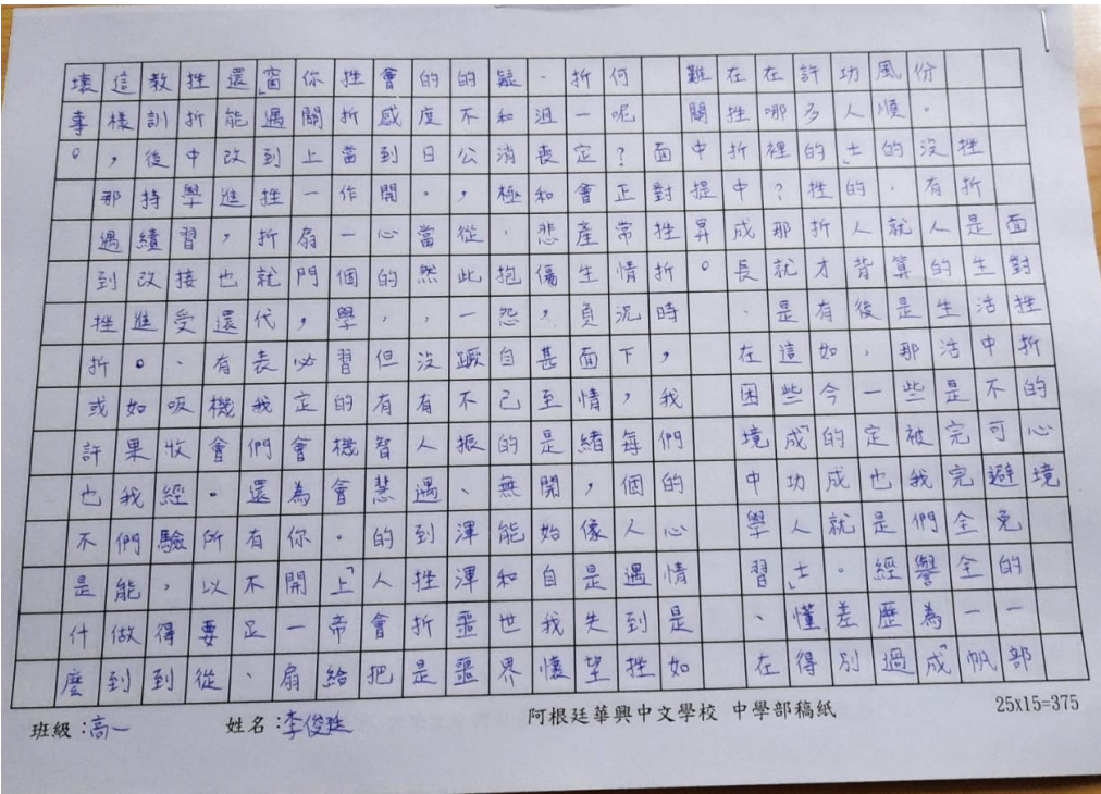
阿根廷華興中文學校2024中學部作文比賽2