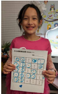
僑委會漢字文化節競賽