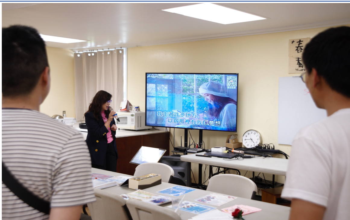
示範教學；TCML-IFY 從唱歌學中文