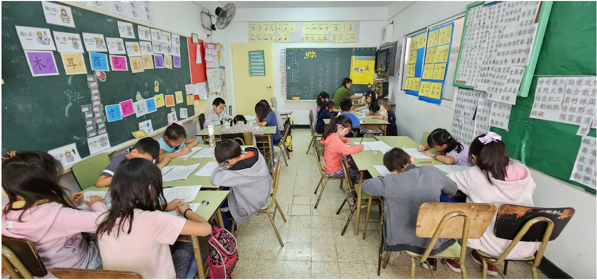
阿根廷華興中文學校2024年 小學部硬筆字比賽2