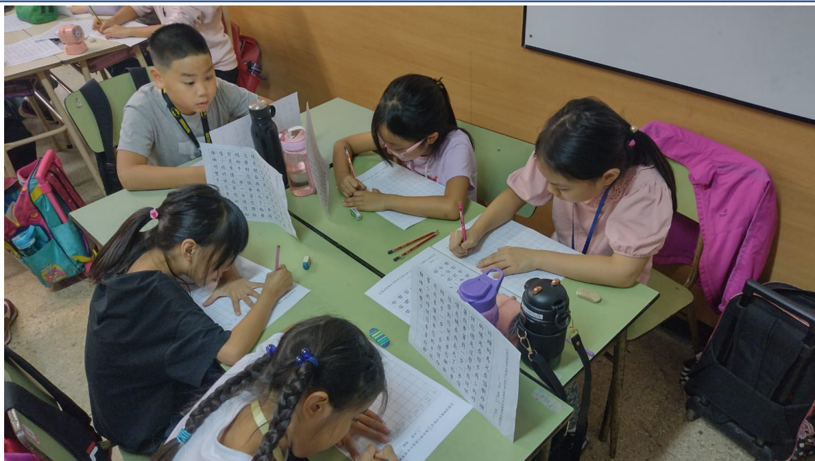
阿根廷華興中文學校2024年 小學部硬筆字比賽5