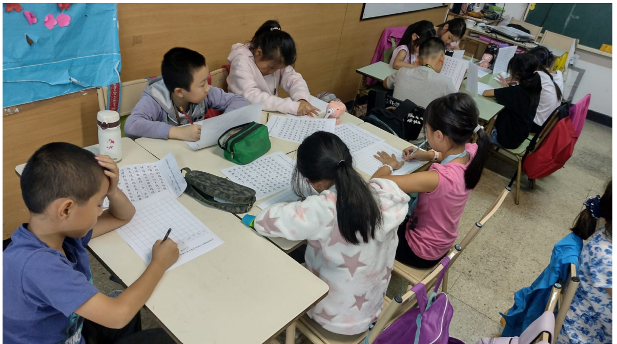
阿根廷華興中文學校2024年 小學部硬筆字比賽1

感謝老師們耐心地教導孩子們，讓同學們在學習的過程中，也能不斷地有自我評量的機會，也感謝僑委會督導鼓勵辦助相關漢字文化節活動，讓孩子的學習過程中，更豐富了多元性成長的機會。