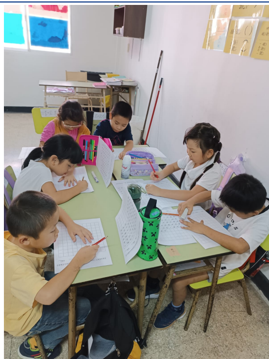
阿根廷華興中文學校2024年 小學部硬筆字比賽3