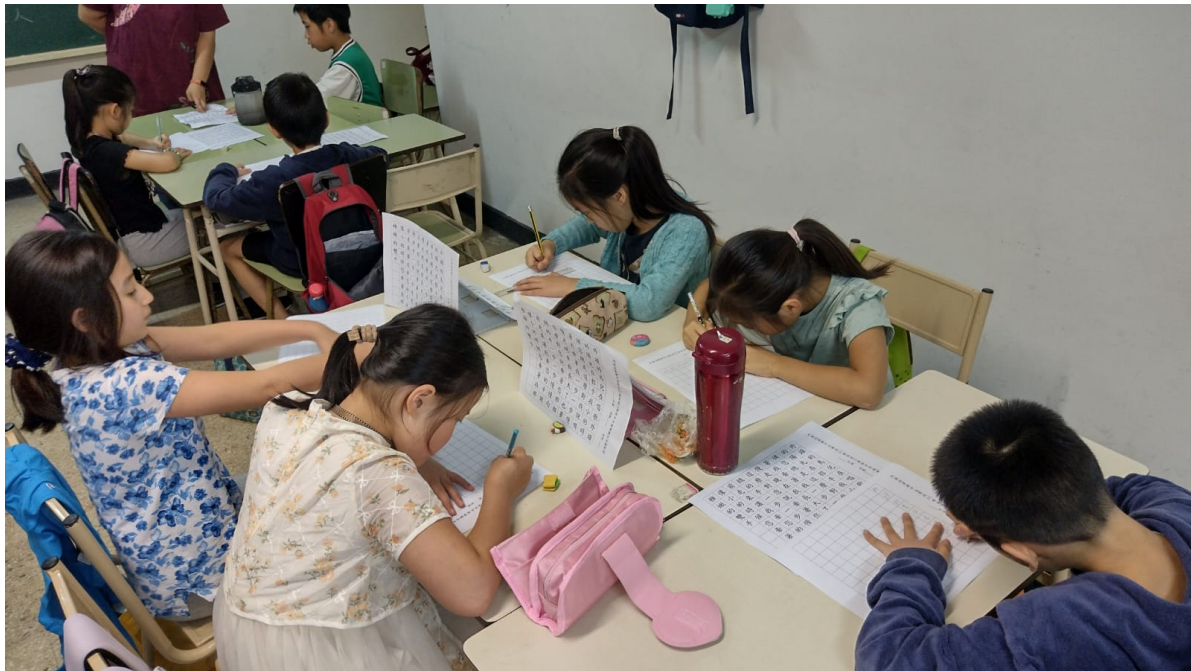
阿根廷華興中文學校2024年 小學部硬筆字比賽6