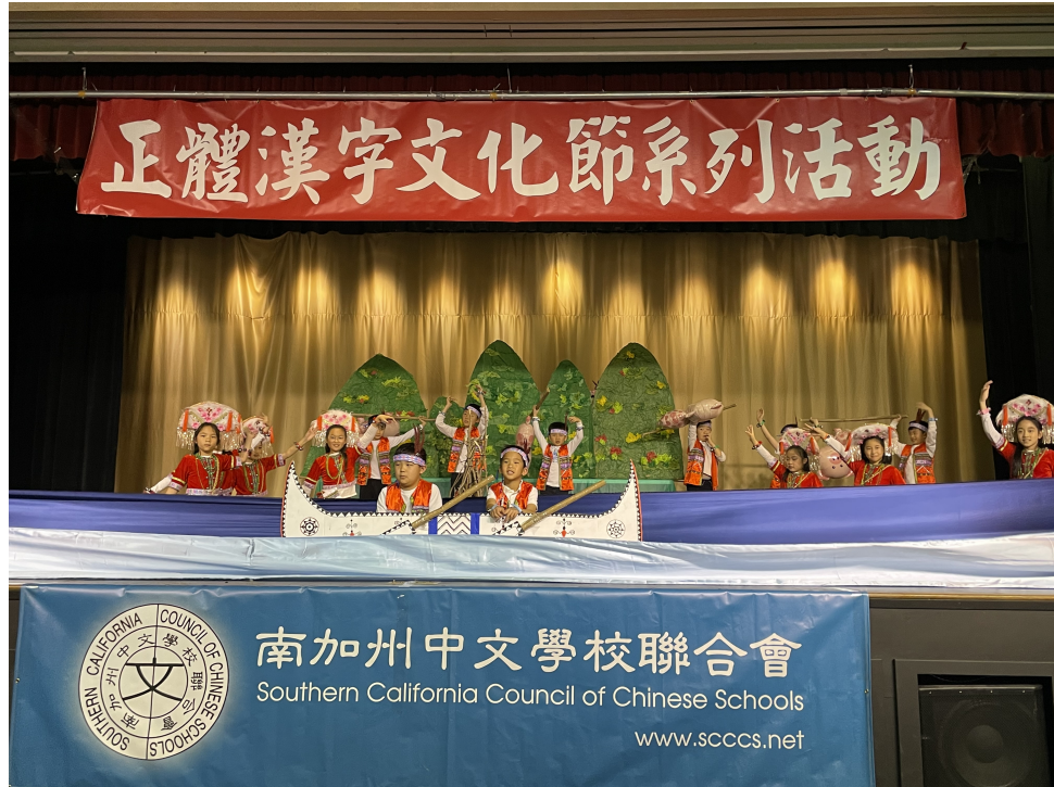
聖瑪利諾中文學校[站在高崗上]舞蹈呈現原住民與大自然融合的在地文化