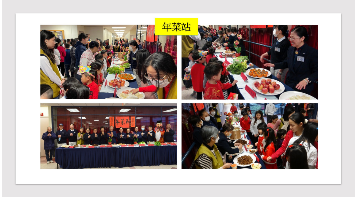
年菜站展示各式各樣的年菜及對應的吉祥話