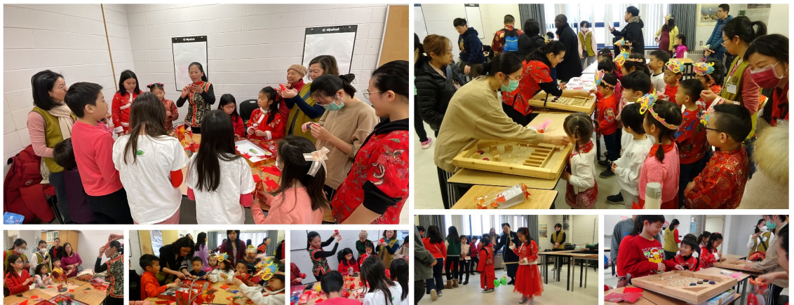
十二生肖配對樂、童玩及紅包魚剪紙