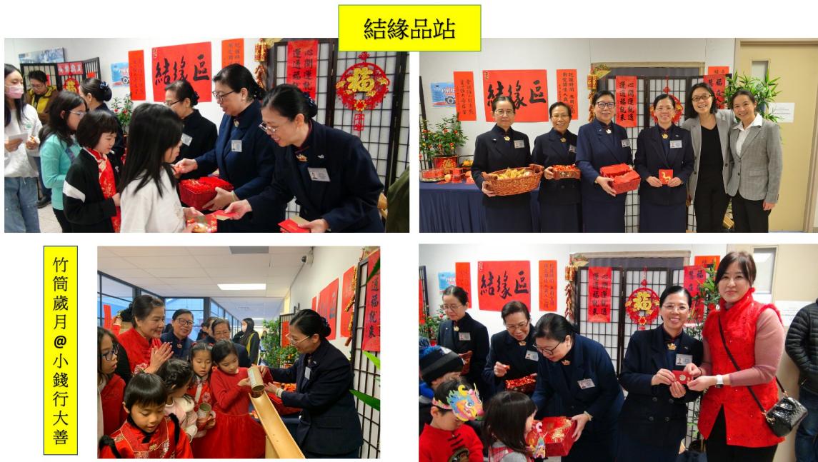
派發龍年紅包和結緣品及竹筒歲月站