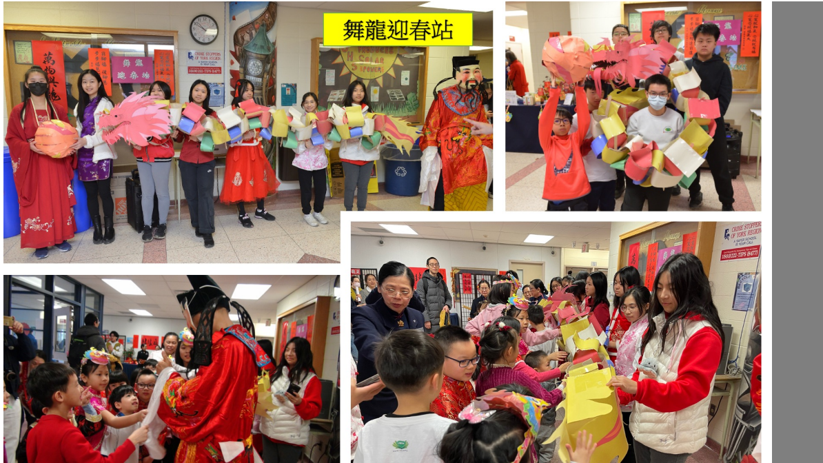
舞龍迎春及財神爺