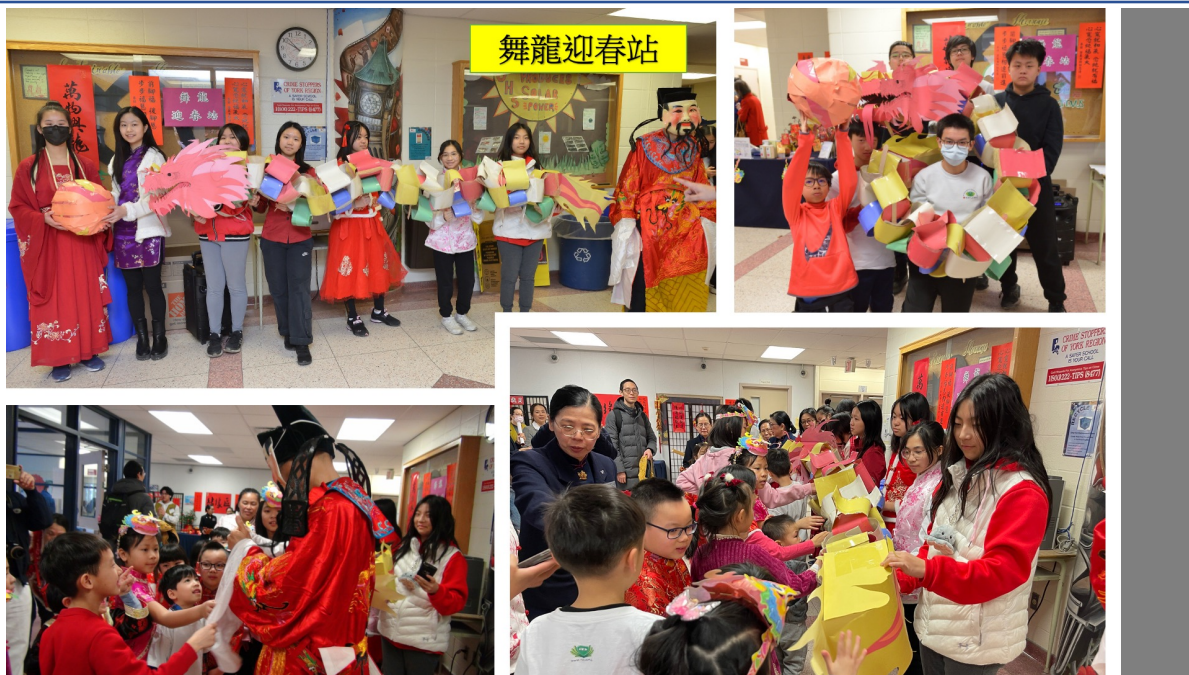
舞龍迎春及財神爺