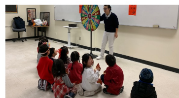
龍騰齊歡賀新春站