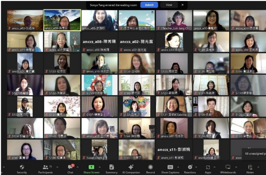
2023北加州中文學校聯合會教學研討會1