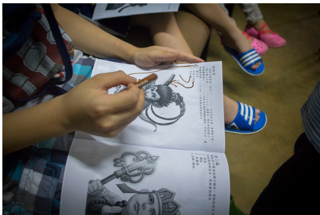
西遊記的Q版人物介紹

的語言來跟服務對象溝通甚至進行教學是必要的。雖然也能邀請翻譯員幫忙，但我認為效果可能會大打折扣，一來難以用自身的感染力感染對象，而來該翻譯員未必對教學內容熟悉，只能從字面上作翻譯，難以更靈活和確實地進行教學。