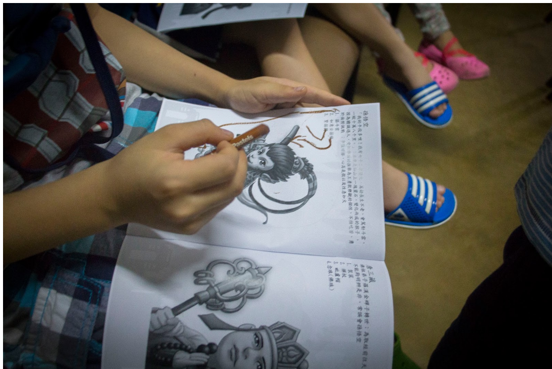
西遊記的Q版人物介紹

的語言來跟服務對象溝通甚至進行教學是必要的。雖然也能邀請翻譯員幫忙，但我認為效果可能會大打折扣，一來難以用自身的感染力感染對象，而來該翻譯員未必對教學內容熟悉，只能從字面上作翻譯，難以更靈活和確實地進行教學。