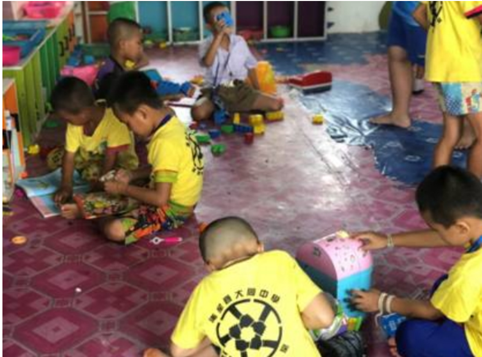
要回去了，回到真正的世界裡－元智大學國際志工泰北團3