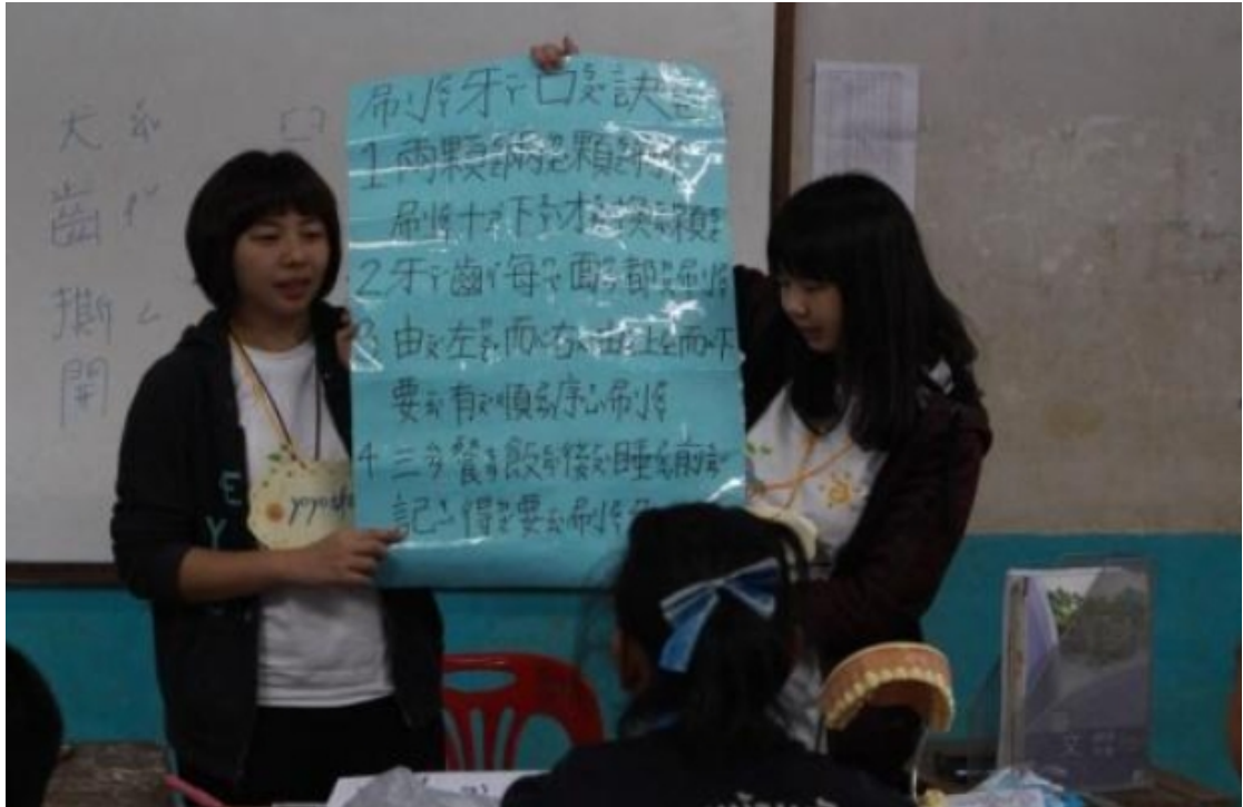
2018寒假 看見北方泰陽 - 政大國際志工社 泰北服務隊2