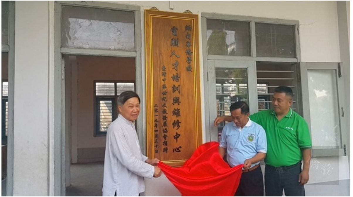
緬北僑校數位教學再進化 電腦人才培訓與維修中心啟用2