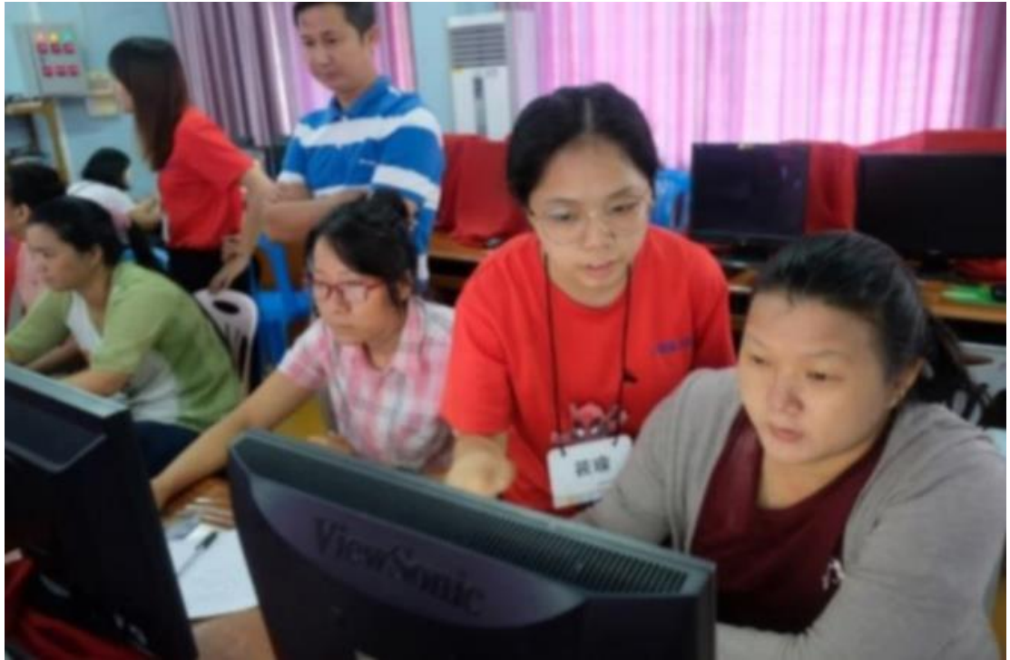
2019手牽手心向心 II—國立臺北商業大學國際志工緬甸隊5