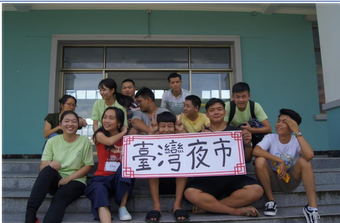
2019手牽手心向心 II—國立臺北商業大學國際志工緬甸隊3