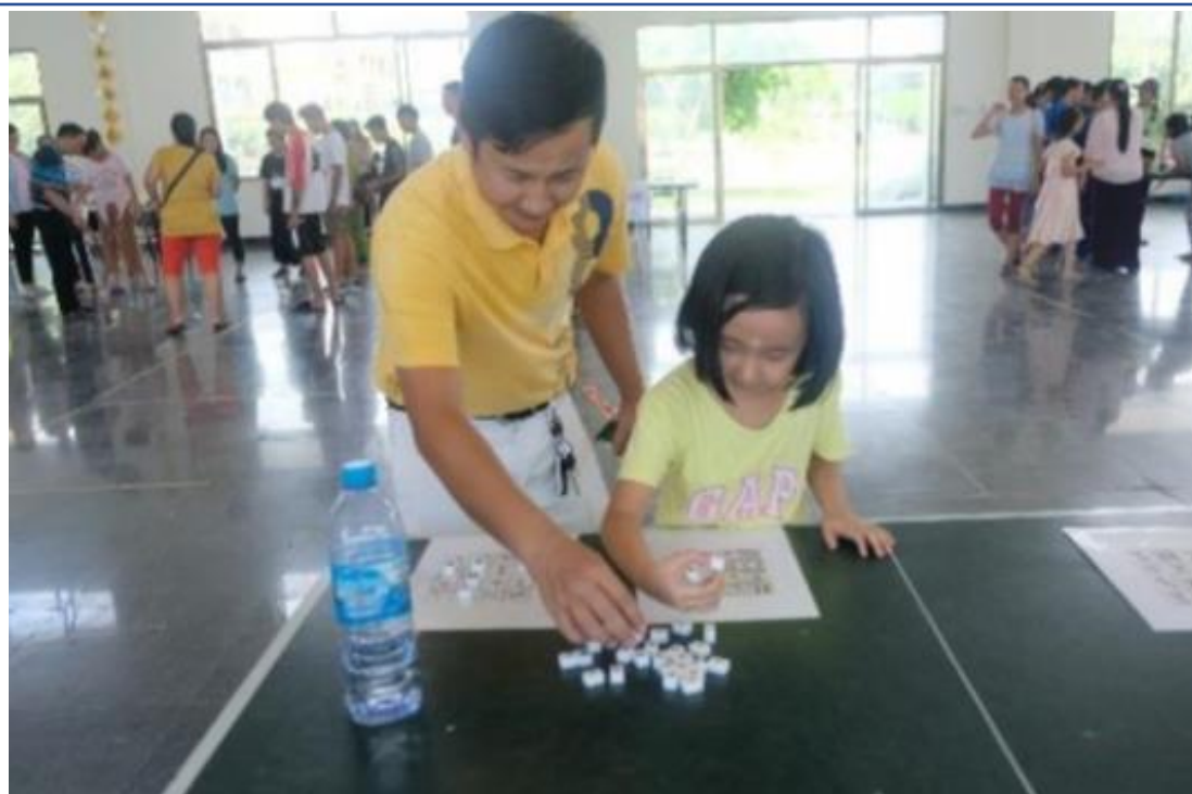
2019手牽手心向心 II—國立臺北商業大學國際志工緬甸隊4