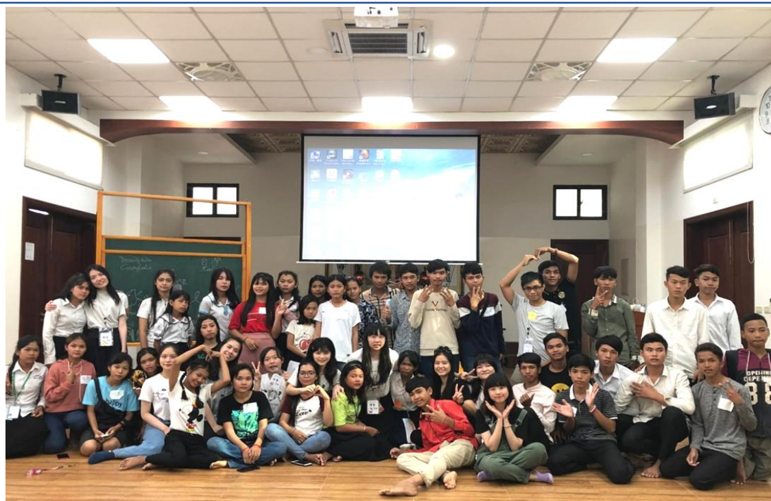
2019育你天天聚寨一起—臺北市立大學1