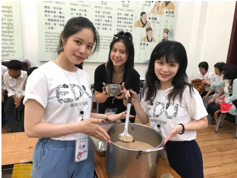
2019育你天天聚寨一起—臺北市立大學3