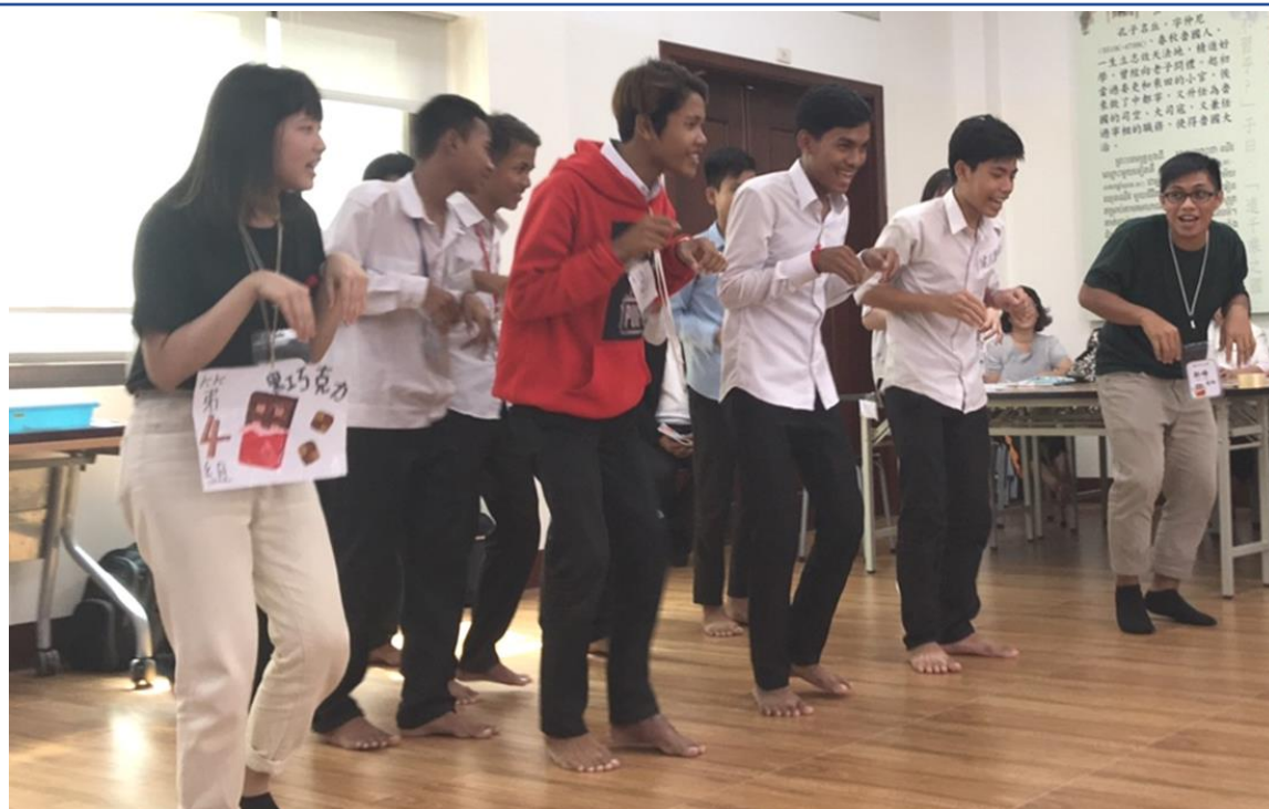
2019育你天天聚寨一起—臺北市立大學2