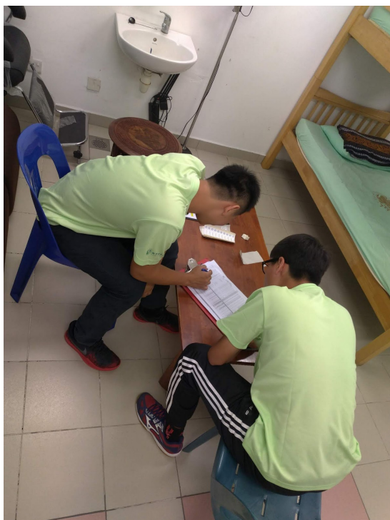
飛越國界—「資」「資」不倦—屏東大學資訊服務社4