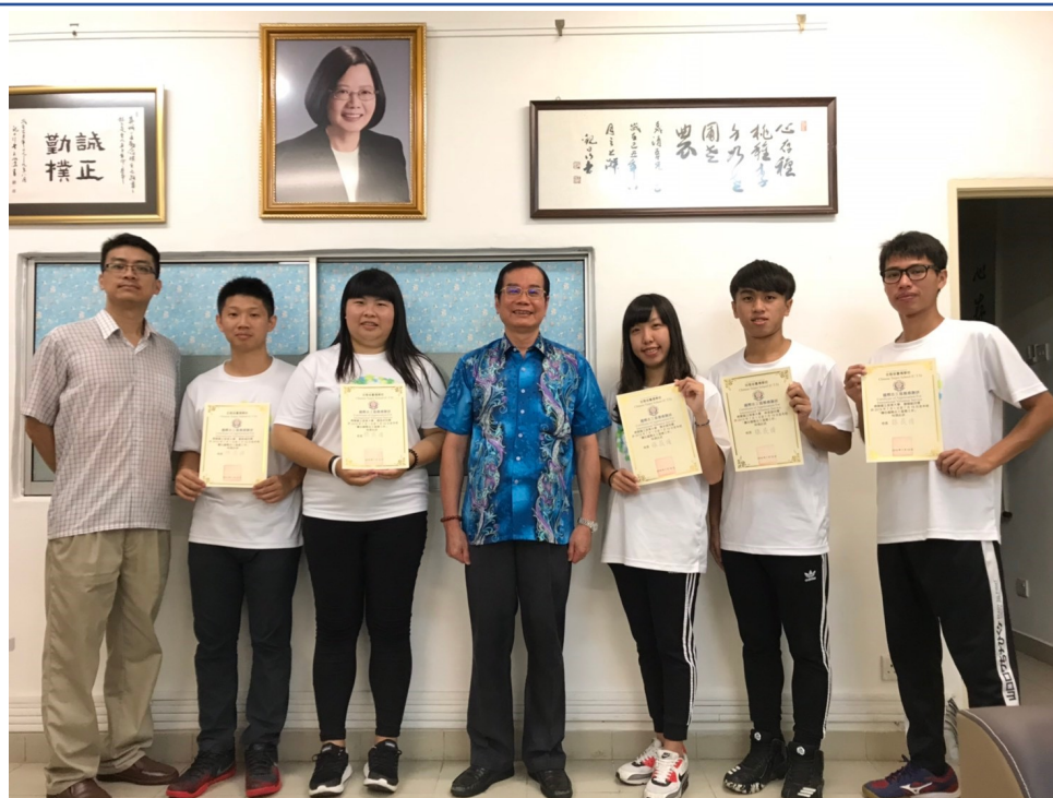
飛越國界－「資」「資」不倦－屏東大學資訊服務社1