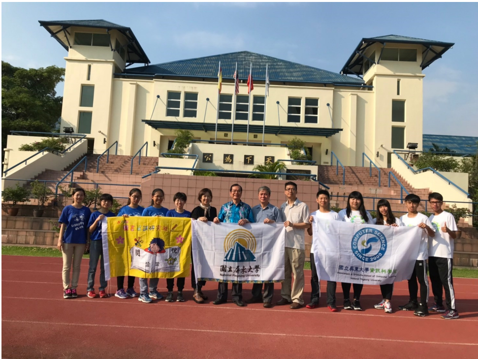
飛越國界－「資」「資」不倦－屏東大學資訊服務社2