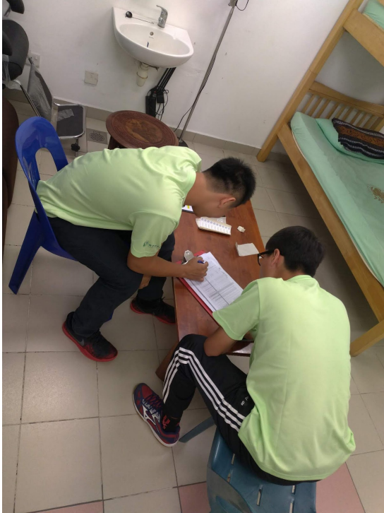
飛越國界—「資」「資」不倦—屏東大學資訊服務社4