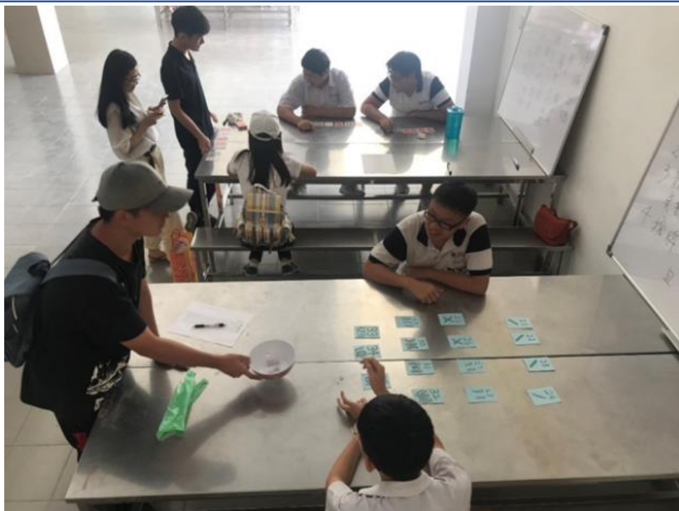
2019年大馬去起來輔導團 輔仁大學數學系3