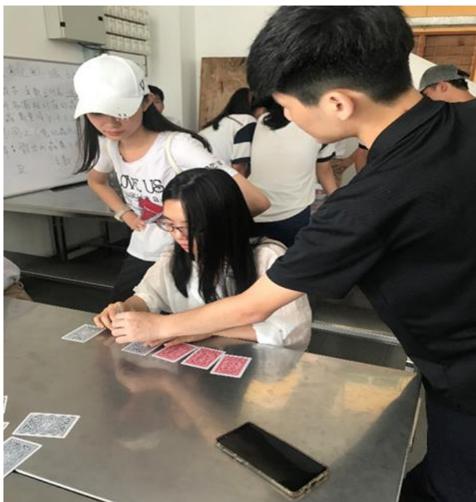
2019年大馬去起來輔導團 輔仁大學數學系4