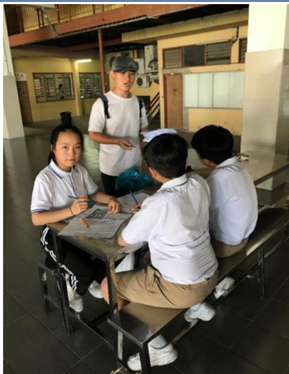
2019年大馬去起來輔導團 輔仁大學數學系2