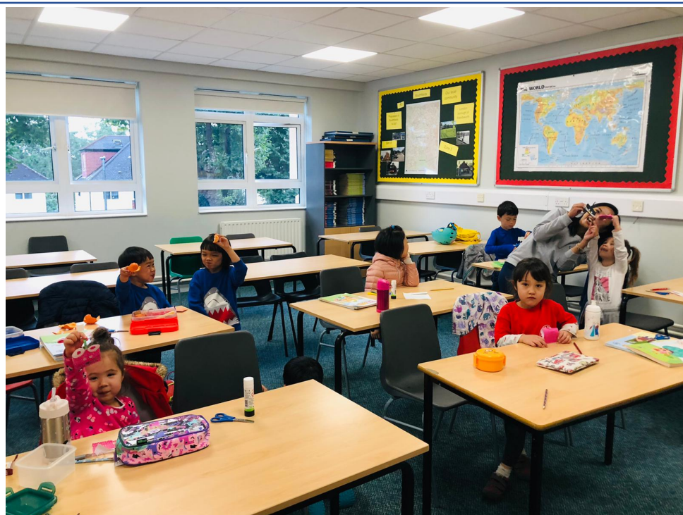
比賽後我們還一起做了手作