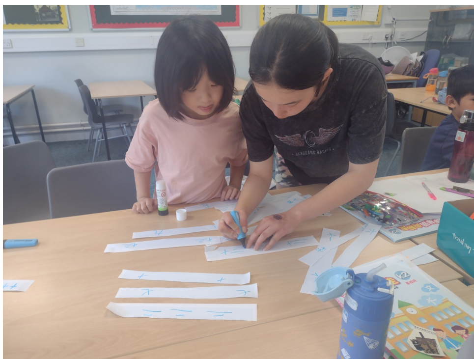
學生們用心籌備分組競賽活動

學習唐詩，讓孩子在唱唱跳跳中也可以將唐詩朗朗上口，畫出唐詩的意境是幫助孩子更深的了解唐詩內容。也讓學員自選唐詩搭配朗讀演繹，另有華語向前走朗讀比賽、聽寫及問答比賽，讓學生們一展學習成果。