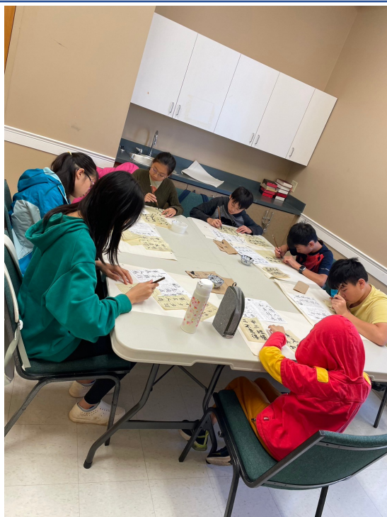
2023海外正體漢字文化節-光華漢字夏夏教2