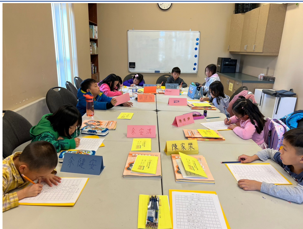
2023海外正體漢字文化節-光華漢字夏夏教4