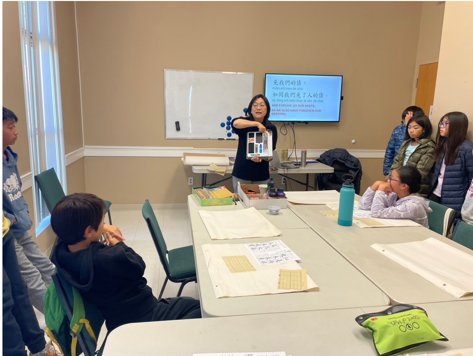
2023海外正體漢字文化節-光華漢字夏夏教6