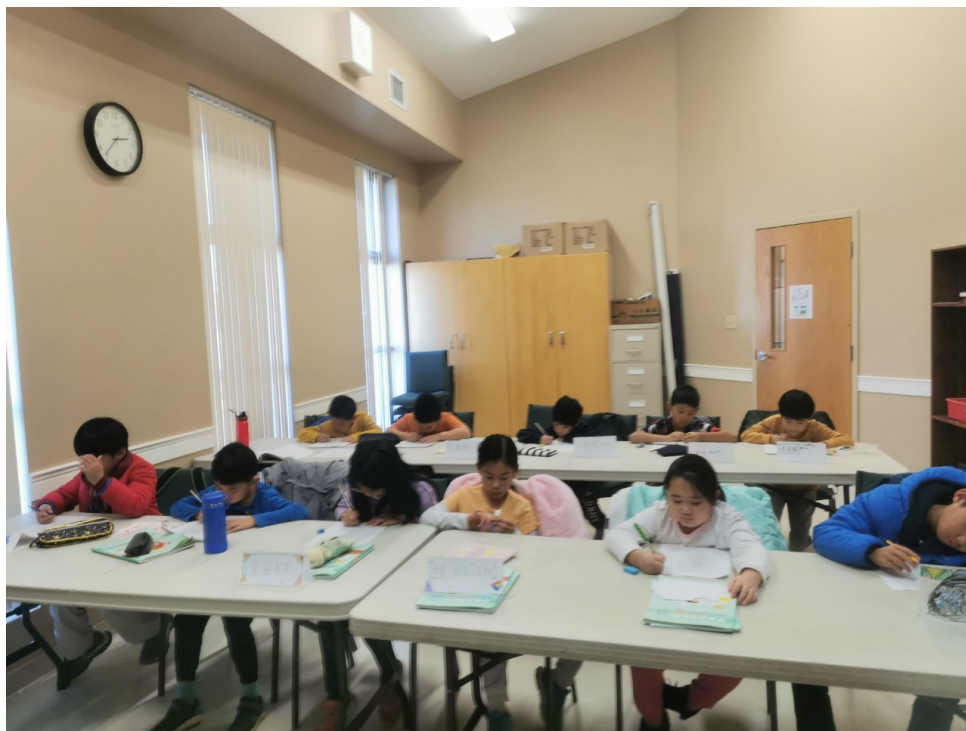
2023海外正體漢字文化節-光華漢字夏夏教1