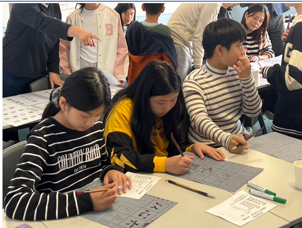
學生毛筆漢字書寫闖關