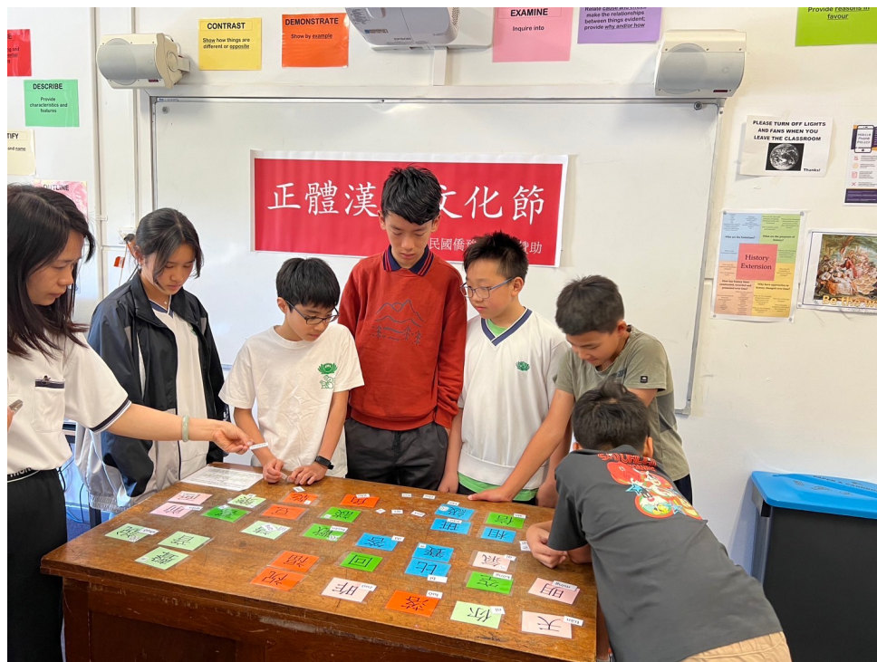
中年級組漢字闖關遊戲

透過參與漢字闖關競賽遊戲，增加孩子對正體字的認識，和鼓勵挑戰者在學習漢字的過程，更加仔細的觀察漢字筆畫的差異。學校也準備了點心和小禮物，鼓勵參加的學生再接再厲，認真學習漢字，並透過漢字的學習，認識中華文化的博大精深，將華人文化在海外繼續傳承，也將我們的漢字推廣給其他國家背景的學生，共創多元文化共榮的社會。