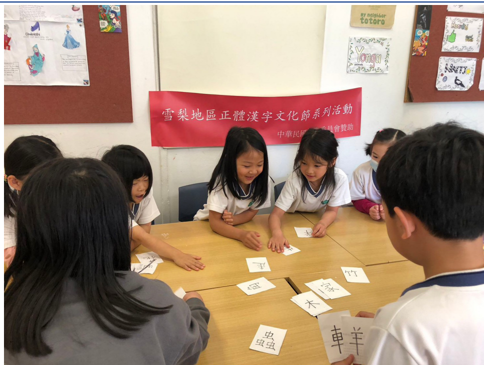
幼稚園組漢字闖關遊戲