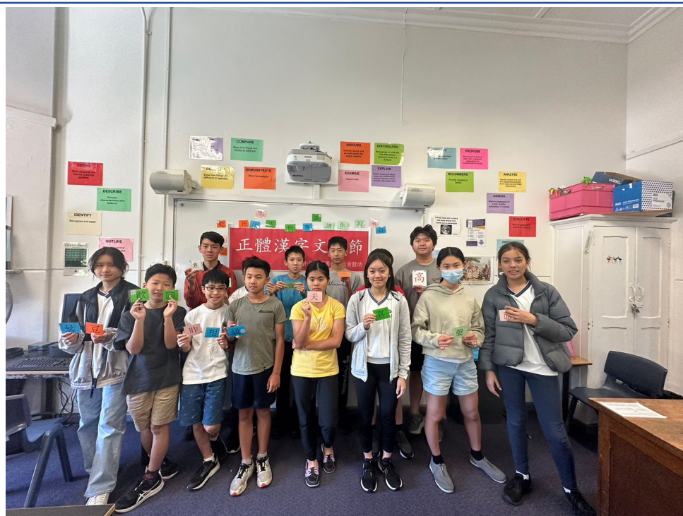
高年級組漢字闖關遊戲合照