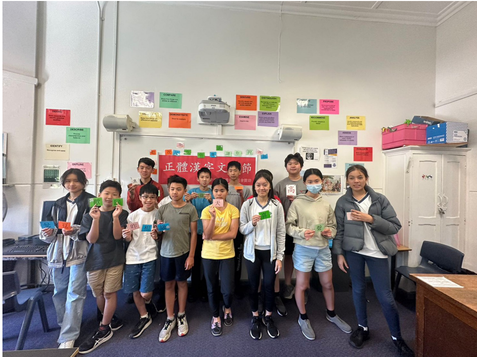
高年級組漢字闖關遊戲合照