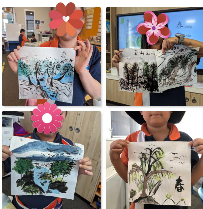
雪梨西北中文學校2023第四學期藝術創想課程2