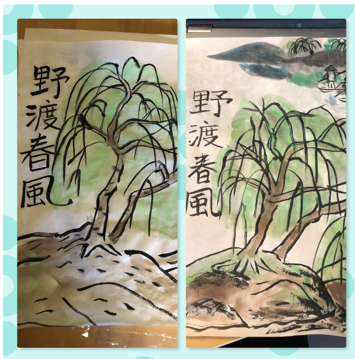
雪梨西北中文學校2023第四學期藝術創想課程1

這學期我們運用毛筆不同的運筆方式，體驗傳統水墨畫的藝術之美，從基本的書法練習，到繪製熊貓和山水畫，不同年級的作品，皆展現出不同的風格。從單一只有黑色的畫，慢慢點綴加入不同的顏色，學生們愈畫愈有成就感。讓我們一起來欣賞學生們的創意作品。