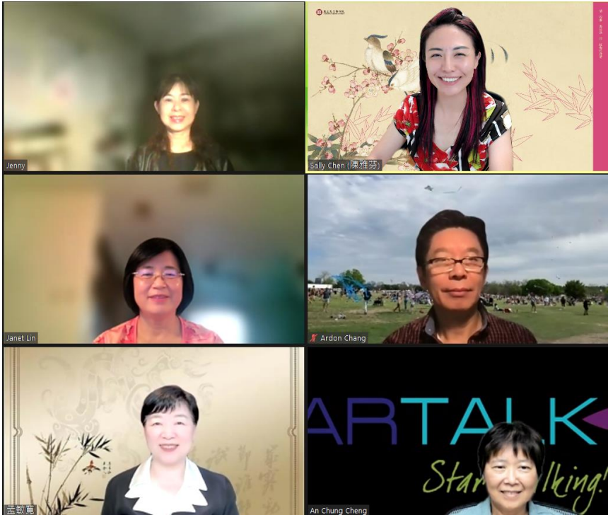
主辦單位工作人員