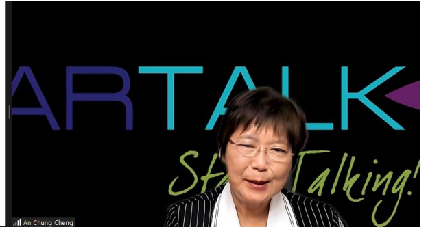
鄭教授的二語教學習得（一）