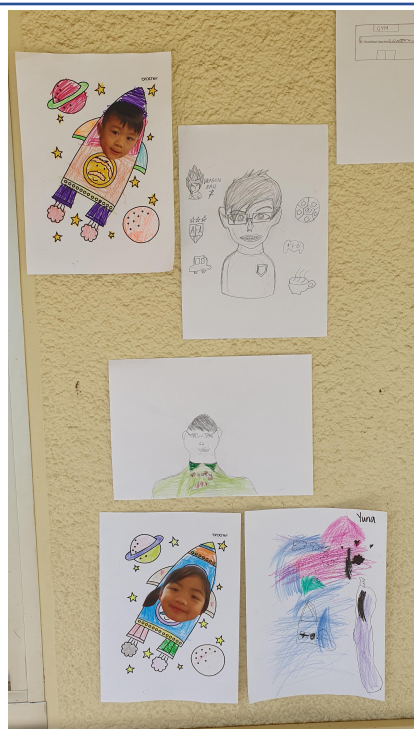
同學們心目中的爸爸