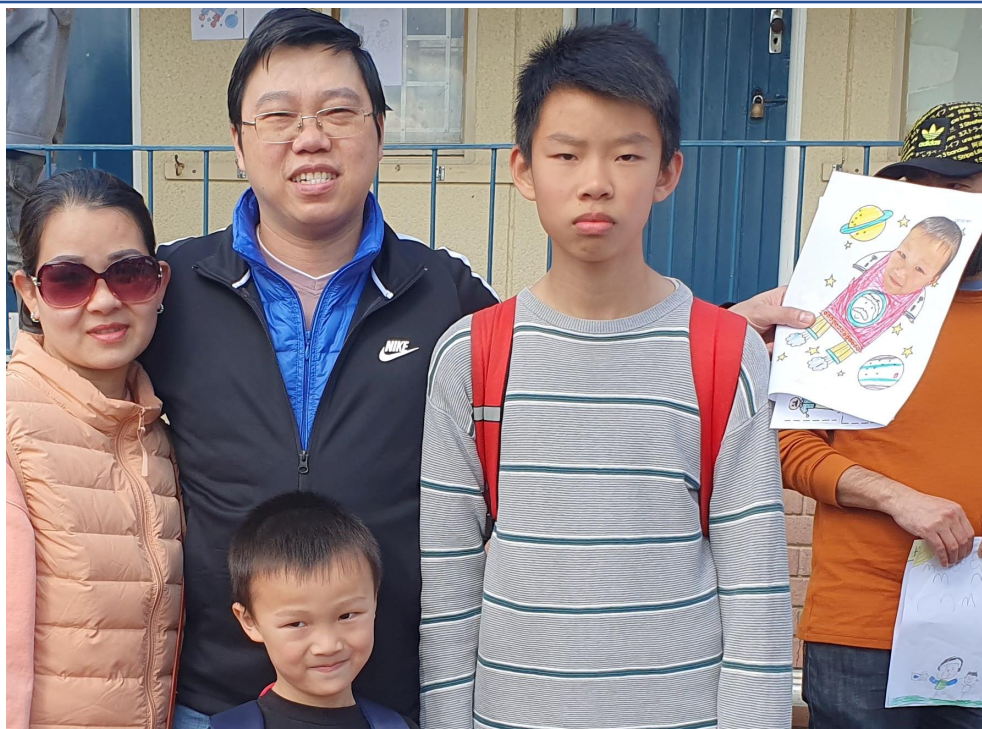
父子同心-知子莫若父