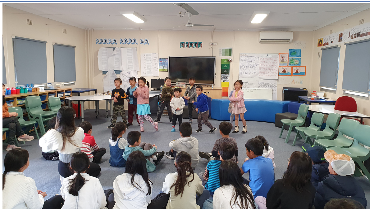
同學們載歌載舞感謝爸爸的辛勞