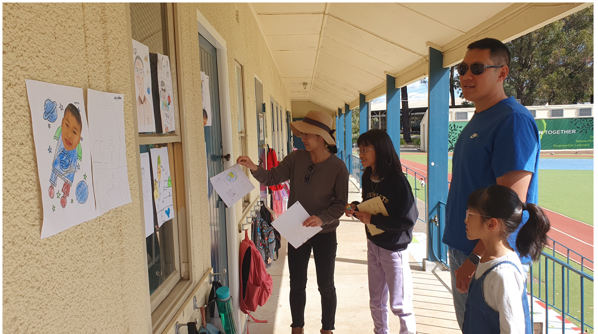
家長找尋自己孩子的作品

父愛絕不亞於母愛。一般而言，在兒女的心目中，父親往往也是他們所崇拜的英雄偶像。儘管各國的父親節不像母親節般的全球一致，而且起源時間也較晚，但是人們對父親表達崇敬的心意是完全相同的。澳大利亞的父親節是在每年九月的第一個星期日。我們西雪梨中文學校在今年父親節的前夕，舉行了一個以「父子同心」為主題，既有趣又溫馨的親子活動。除了有各班級同學們分別表演歌舞以及自作的白話詩歌朗誦之外，還有同學們事前所繪畫的「我的爸爸」圖像，張貼在教室外的門窗和牆壁上，讓與會的家長們找尋自己孩子的畫作，展現父子心靈相通的樂趣。活動結束時，家長和同學們都得到了一支棒棒糖的小禮物，歡欣甜蜜地攜手回家。