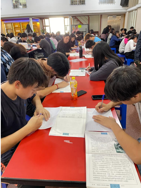
112學年度愛育學校正體漢字文化節「全校寫字比賽」5