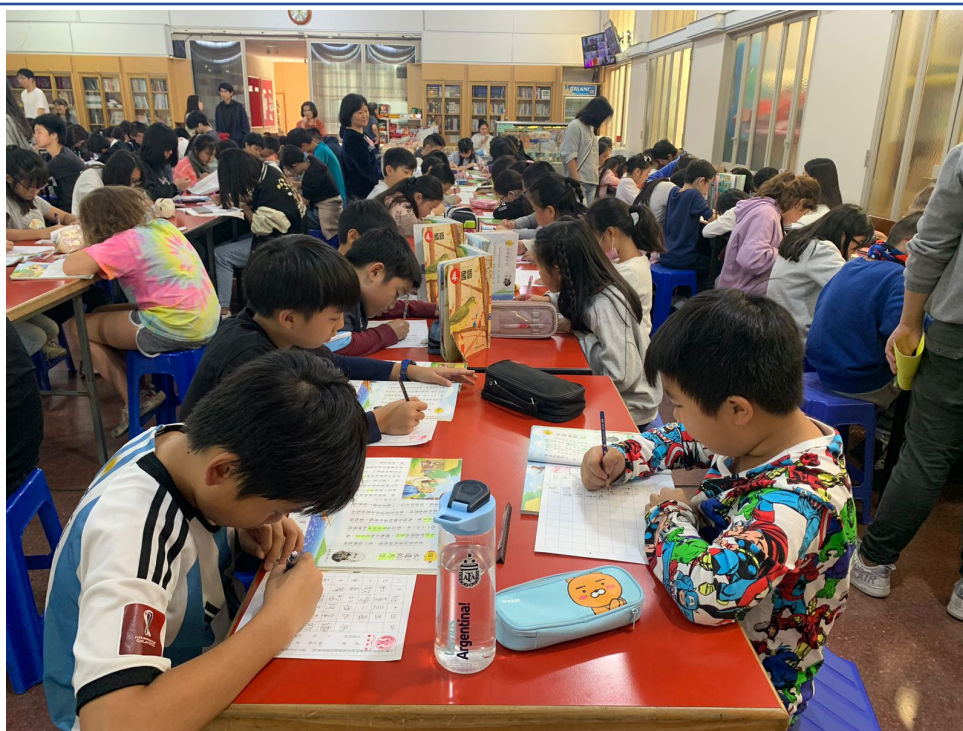
112學年度愛育學校正體漢字文化節「全校寫字比賽」1