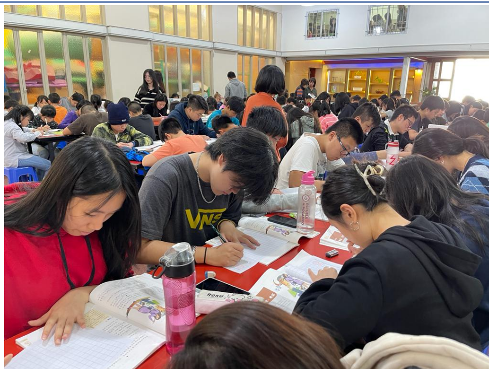
112學年度愛育學校正體漢字文化節「全校寫字比賽」4