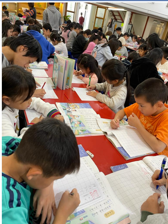
112學年度愛育學校正體漢字文化節「全校寫字比賽」2