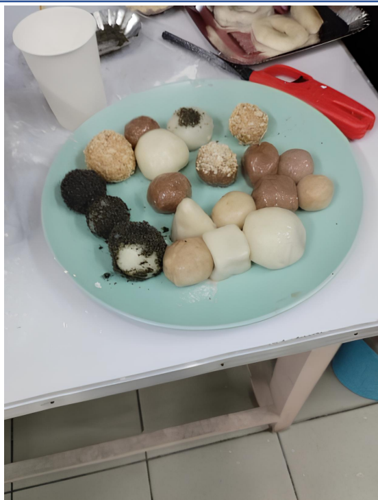
▲各種形狀樣式與色彩的麻糬令人食指大動