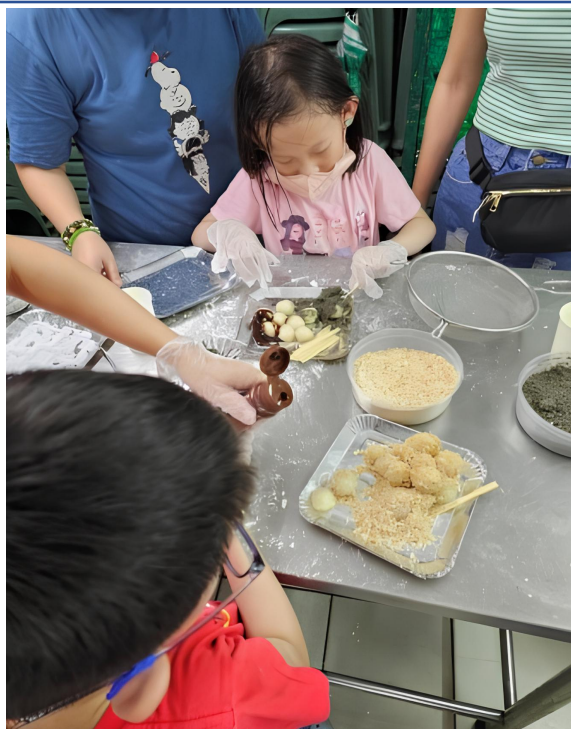
▲學生與家長一起動手製作麻糬