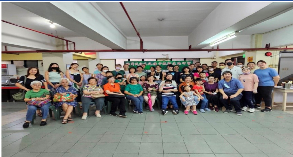
▲師生與家長一同參加台灣美食文化麻糬製作專題講習與 實作團體合照