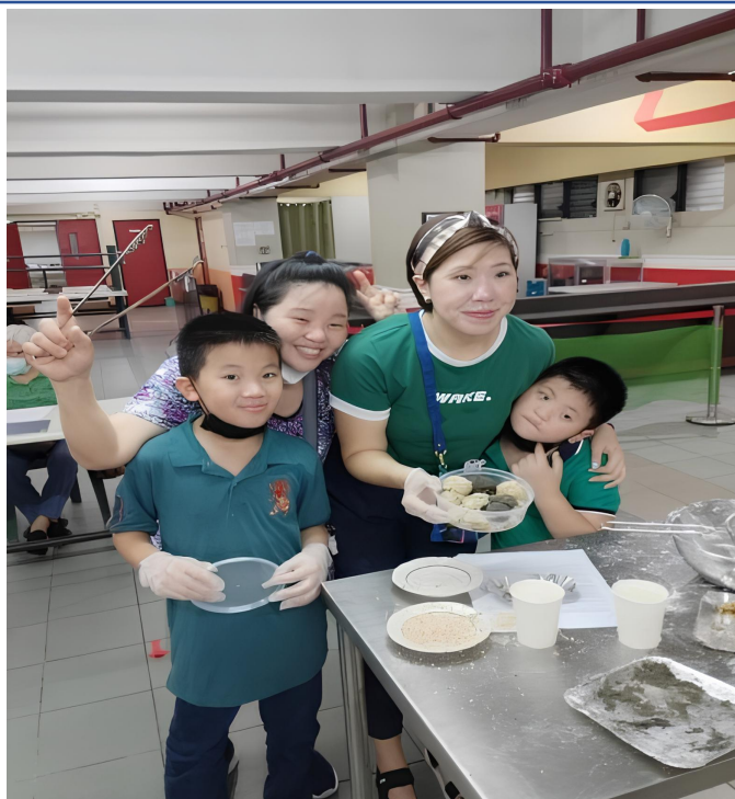
▲成果展示全家滿滿笑容