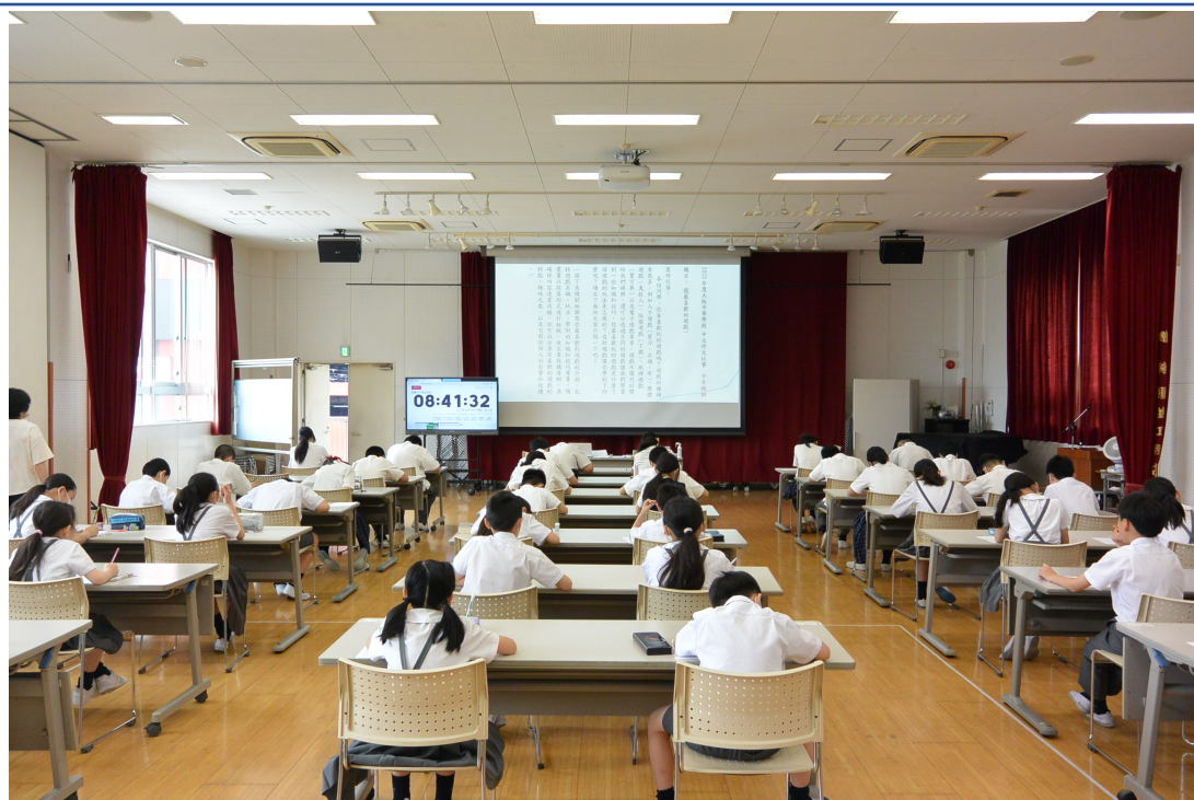
華語文作文比賽中