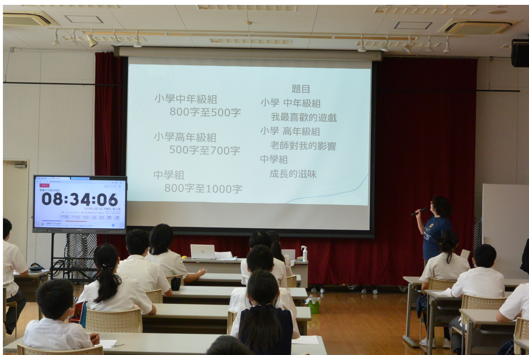
華語文作文比賽會場