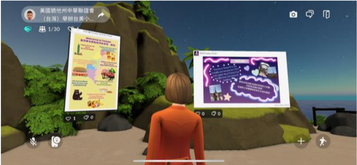
GOXR元宇宙展場布展臺灣再興小學中英文簡介和介紹臺灣文化特色的卡片