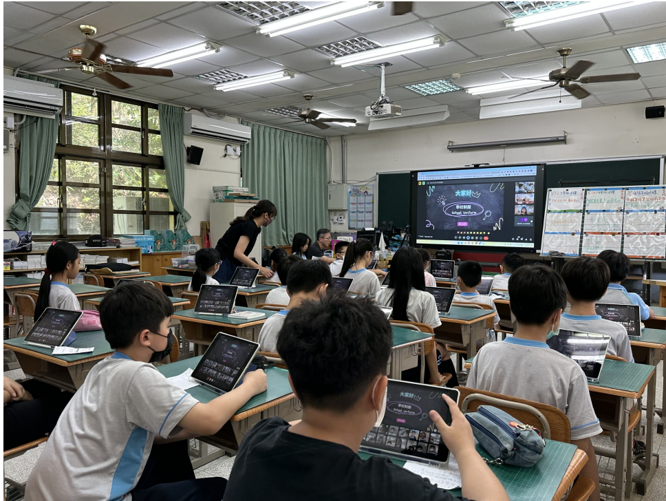
南投縣延平國小與鳳興書院「校園生活」交流現場實況