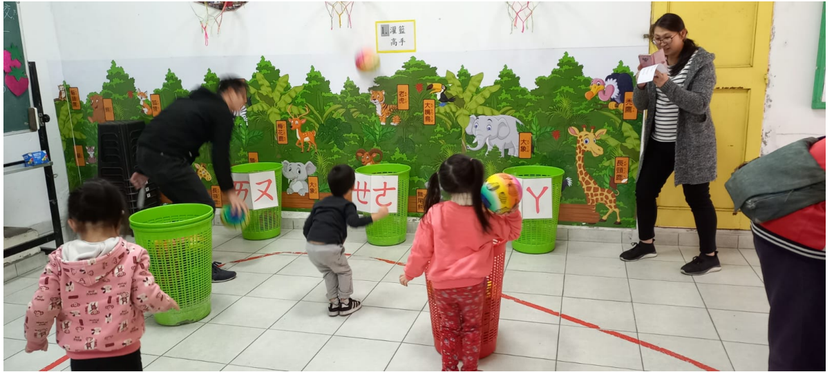
2023漢字文化節 親子注音闖關語文活動2