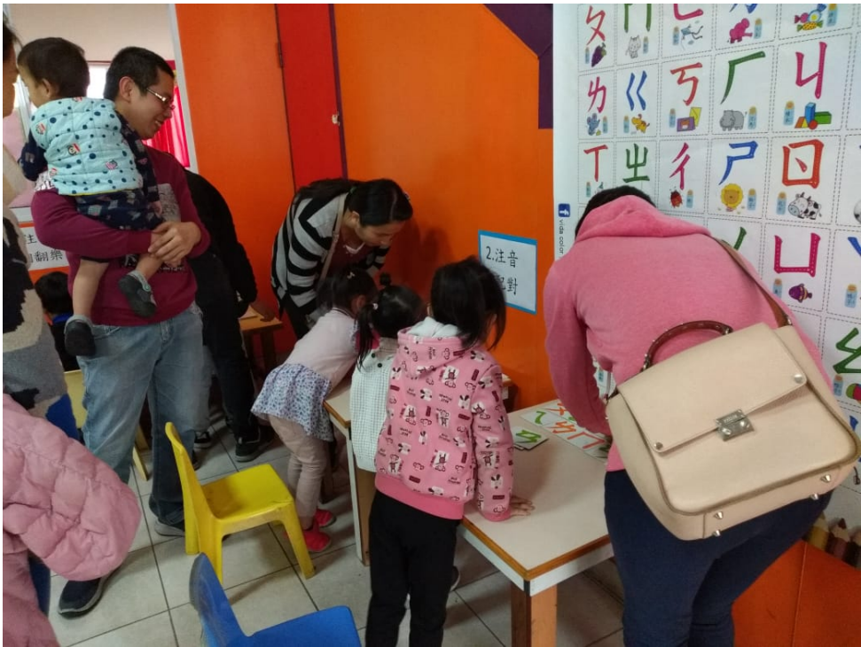
2023漢字文化節 親子注音闖關語文活動4