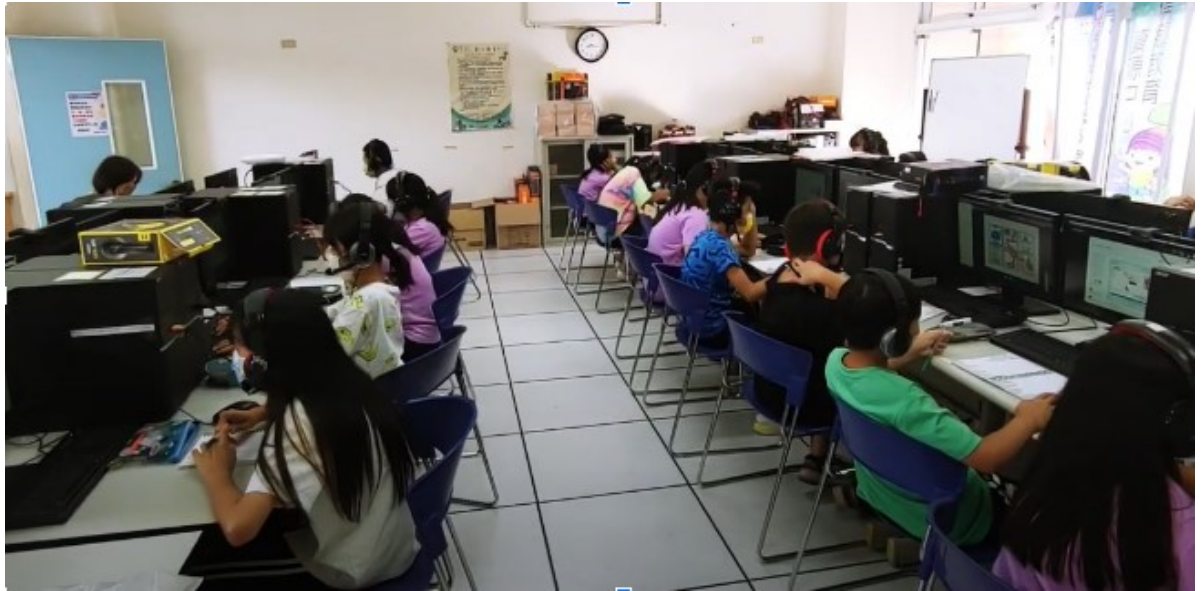
高雄甲仙國小同學們晨間英語視訊