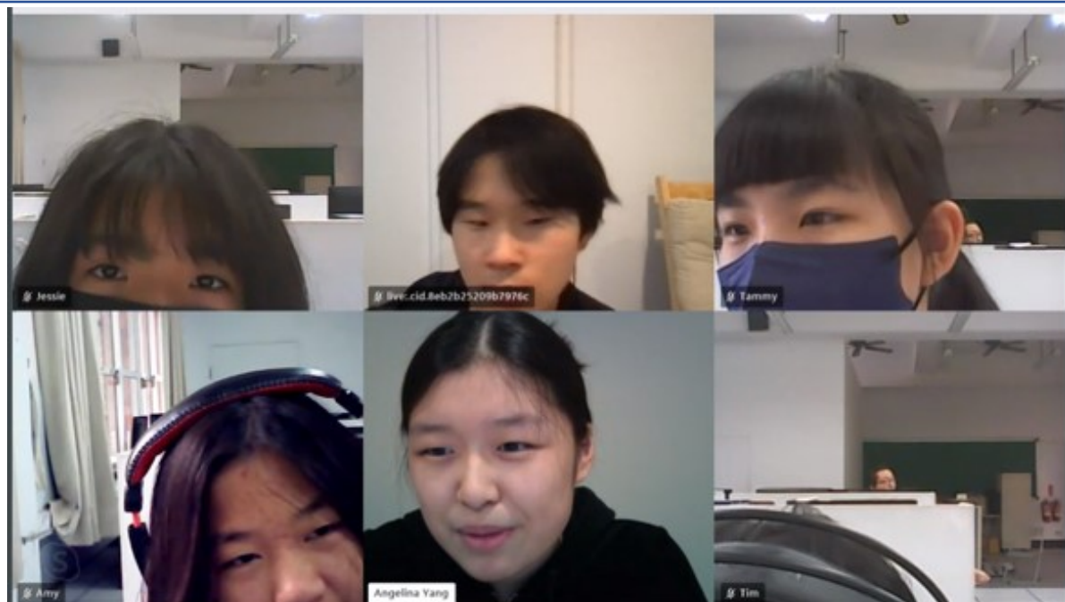
小老師和甲仙國小同學認真上課