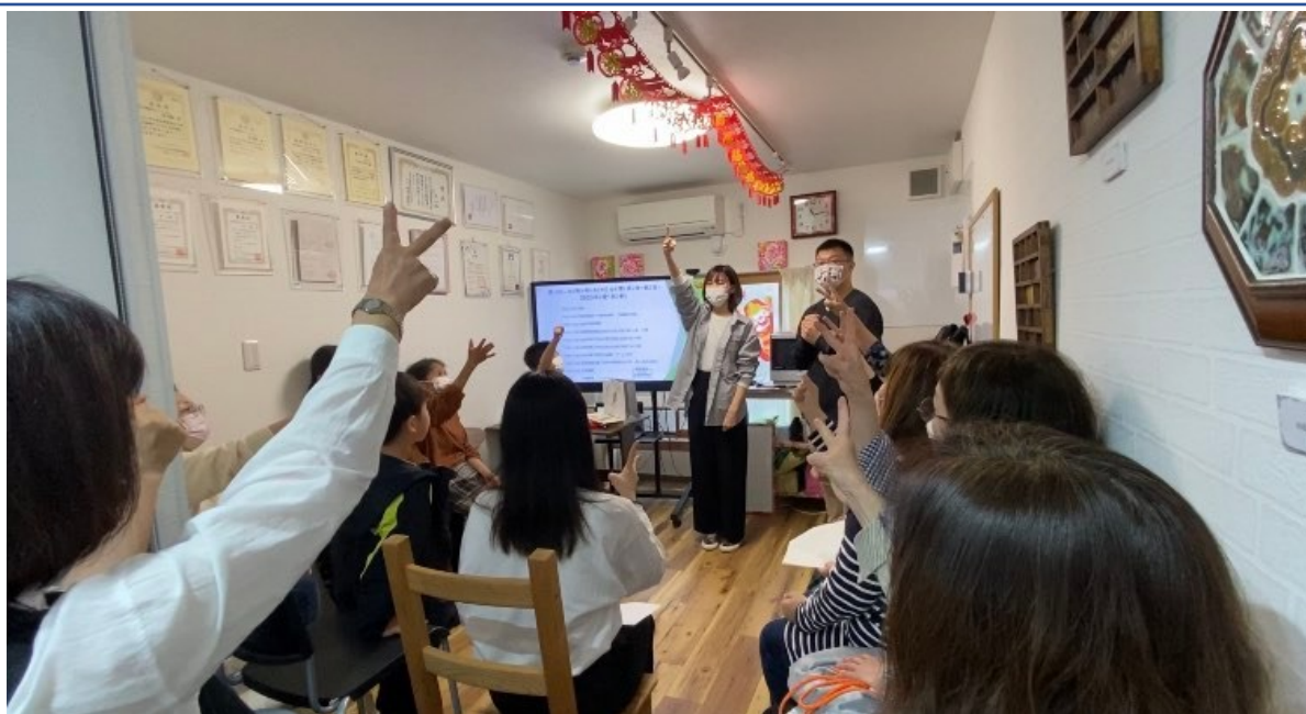
臺灣華語遊戲發表